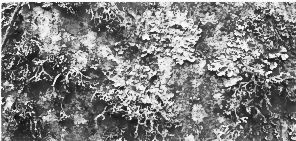
Gros plan de la flore lichénique en zone peu polluée. ( Parmelia caperata , Parmelia physodes , Pertusiana amara ).

Depuis cette date, de nombreuses mesures ont été prises par les industries rouennaises pour limiter le volume des effluents : citons notamment la mise en place, fin 1974, du R.E.M.A.P.P.A. (Réseau d'étude, de mesure et d'alarme pour la prévention de la pollution atmosphérique en Basse-Seine). Par une action volontaire, les industriels s'engagent à réduire ou à stopper leur installation dès que le « niveau de pollution » mesuré dans le réseau atteint une cote d'alerte. Il était donc particulièrement intéressant de voir la réaction de la flore lichénique épiphyte face à ce changement de volume des effluents polluants.