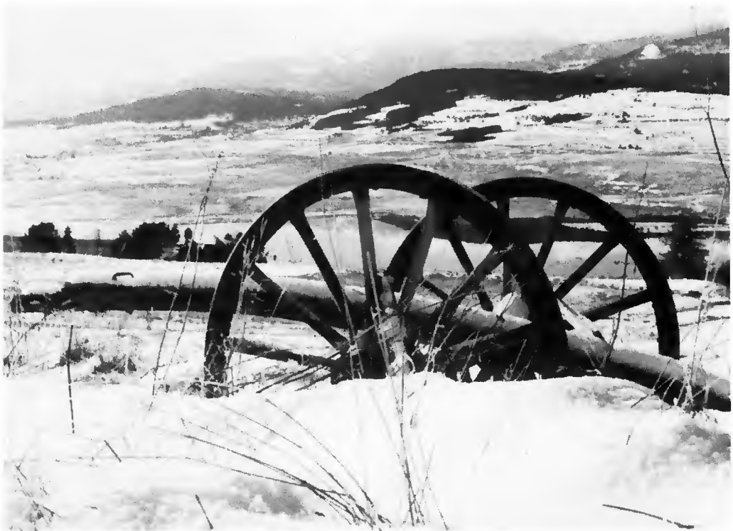
Le plateau du Capcir, au fond, Formiguères