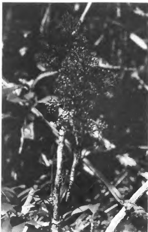
Parasitaxus ustus : arbuste de 1 à 3 m de haut, de couleur rouge, formé d'une tige orthotope, surmontée d'une cime arrondie.