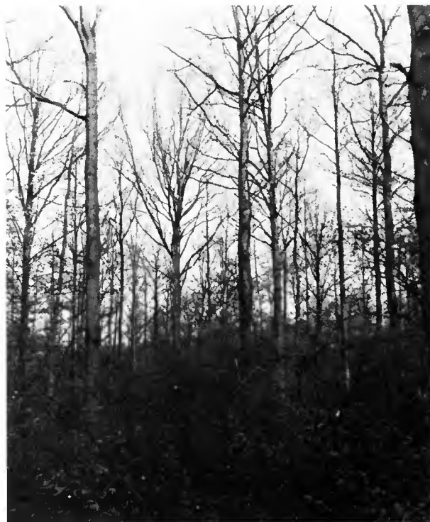
Bois des Socs, région de Mariembourg (Entre-Sambre-et-Meuse)

Les aménagements recommandent en outre de contrôler la marche des régénérations en veillant à ce qu'à chaque passage en coupe, on assure ou prépare une surface minimum de rajeunissement. Par exemple, si l'âge d'exploitation théorique des arbres de la futaie est de 144 ans et si la rotation des coupes est de 12 ans, on doit en principe assurer à chaque passage le rajeunissement de 12/144 = un douzième de la surface de la coupe. Par contre et fort malheureusement, les aménagements n'imposent pas l'inventaire des peuplements. C'est une lacune regrettable, car les inventai-