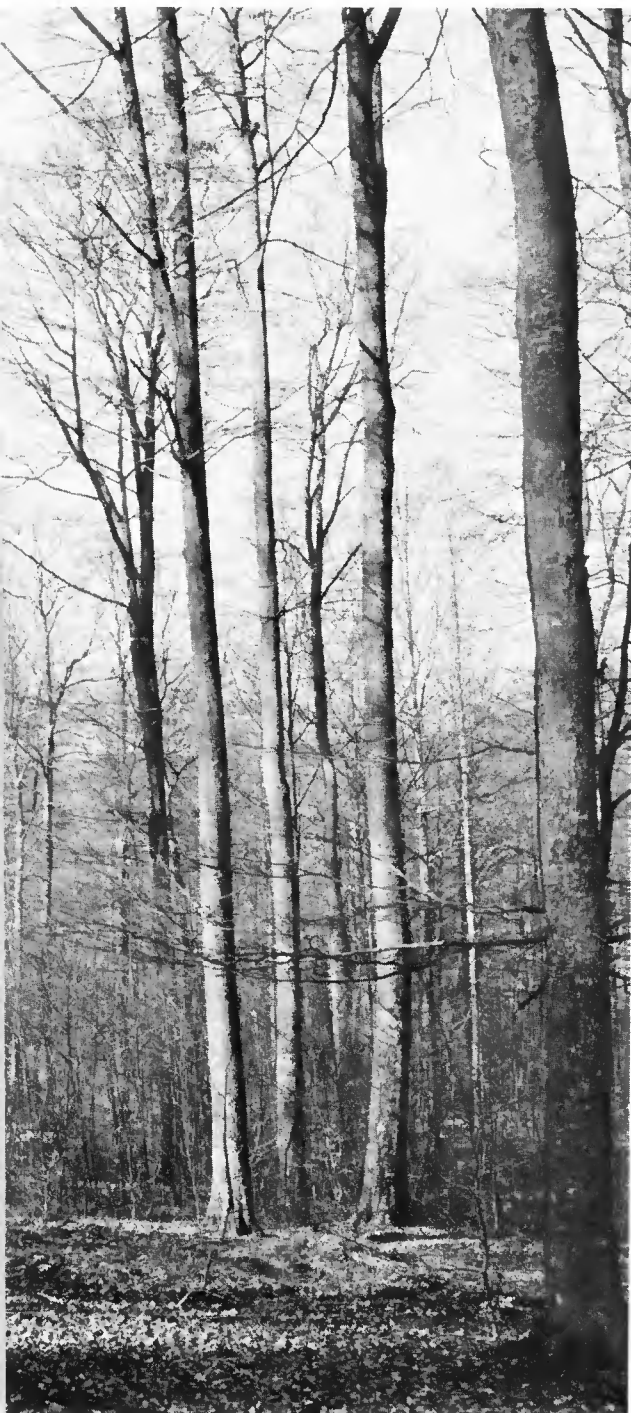
jardinée de fort bonne venue et de bonne production. Vieux sujets nés vers 1810, gaulis et jeunes perchis de 1936 et 1942.