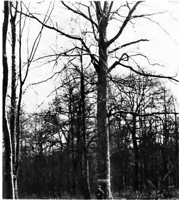
Bois communal de Mâcon région de Chimay (Ardenne occidentale)

Ce traitement de la futaie claire ne peut se défendre que dans les sols de bonne production par le niveau de fertilité, les ressources en eau et les propriétés physiques... Le peuplement serait donc une véritable futaie jardinée par groupes plus ou moins étendus mais claire, laissant percer assez de lumière pour qu'un sous-bois herbacé ou ligneux puisse y subsister. »