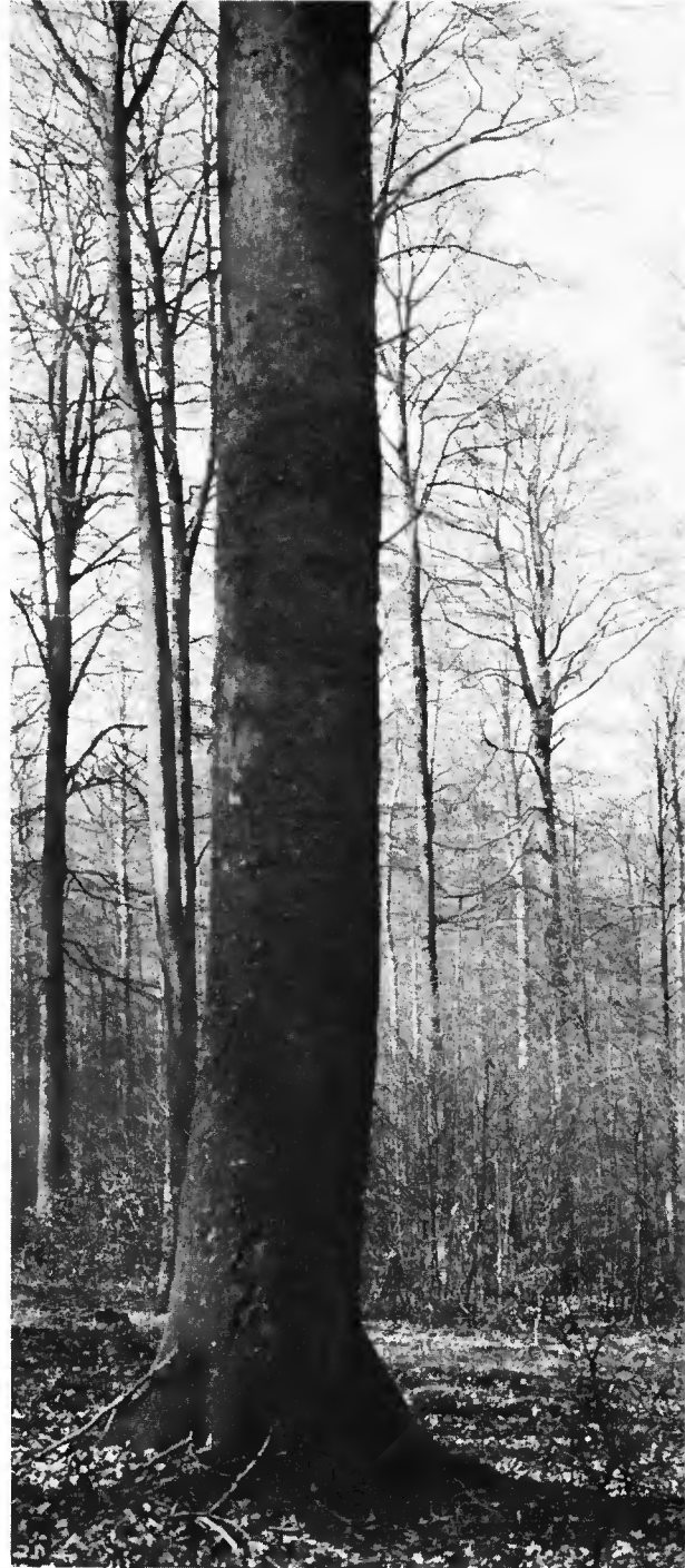
Bois communal de Lavacherie en forêt de Freyr près de Saint-Hubert (Ardenne centrale)

Les hêtraies de la Lorraine belge, qui occupent des sols plus fertiles du Jurassique inférieur, sont aussi bien plus mélangées. Le hêtre, toujours prépondérant et d'une très grande vigueur, s'y trouve associé, parfois en assez fortes proportions aux deux Chênes ( Quercus sessilis Ehrh. et Q. pedunculata Ehrh.) aux deux Érables ( Acer pseudoplatanus L. et A. platanoides L.), au Frêne ( Fraxinus excelsior L.) et même au Merisier ( Prunus avium L.).