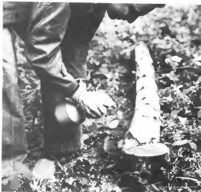
▲ Atomiseur de jardin contenant un litre de solution d'urée colorée pour traitement de 20 souches.