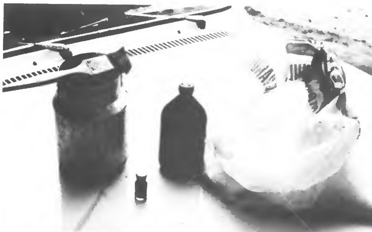
◀ Matériel sommaire de traitement : seau, pinceau, colorant turquoise Lissamine AN et urée.