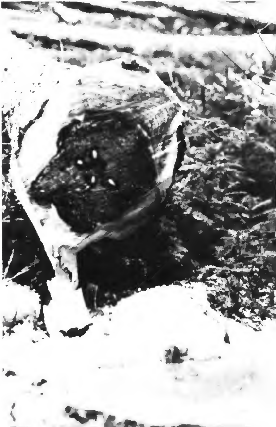
Pourriture centrale sur épicéa en forêt de Tantonville (Meurthe-et-Moselle).

Compte tenu de la venue en première éclaircie d'un grand nombre de plantations résineuses réalisées par le Fonds forestier national et des connaissances acquises en matière parasitaire, il est apparu nécessaire au Service des Forêts d'appeler l'attention des gestionnaires de la forêt sur les risques d'installation du Fomes annosus dans les peuplements de résineux de première génération lors des éclaircies et notamment lors de la première.