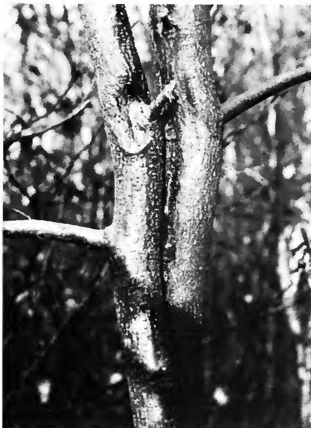
Les frottements entre les tiges sont à l'origine d'un nombre de chancre limité : les régénérations naturelles denses ne sont pas plus menacées que les autres.

Toutes ces études révèlent l'influence des conditions climatiques et stationnelles, entendant par station une unité géographique et climatique et au mieux une unité topographique et pédologique homogène. Les études très précises effectuées par Becker (1979) pour la forêt de Haye Meurthe-et-Moselle — hêtraie calcicole) et par Le Tacon et Timbal (1975) pour la forêt de Darney (Vosges — hêtraie acidophile) nous offraient l'occasion d'étudier l'incidence du chancre du hêtre dans un contexte de stations très bien définies représentant assez bien l'éventail des conditions stationnelles des hêtraies de plaine du Nord-Est.