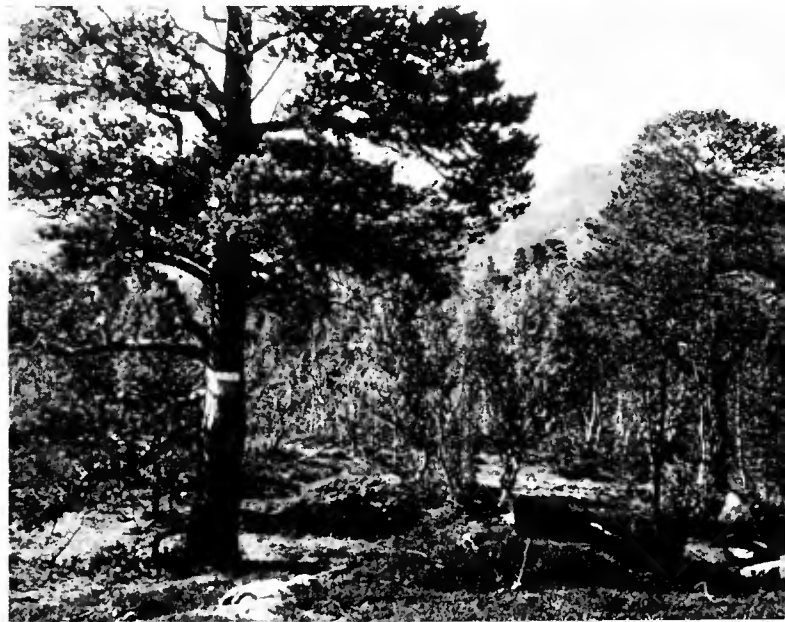
En forêt de Stabursdalen.