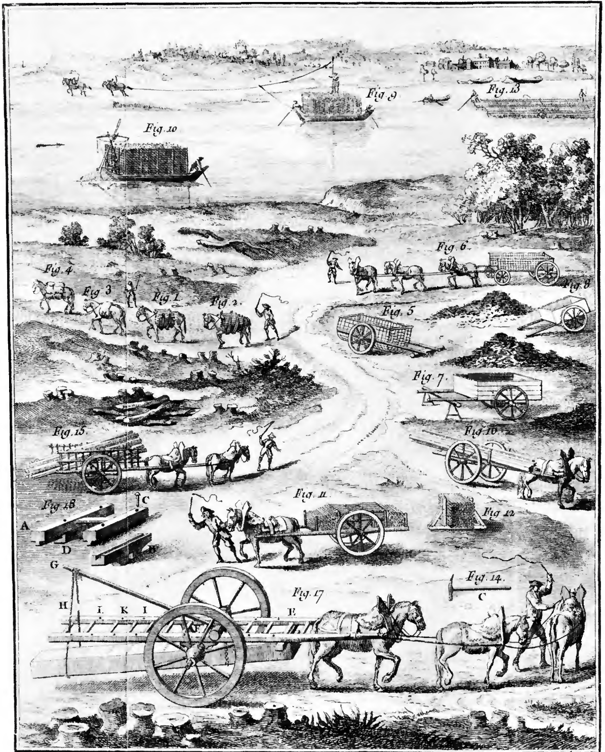
(Du transport des bois de Duhamel du Monceau. — Paris, M.DCC.LXVII)