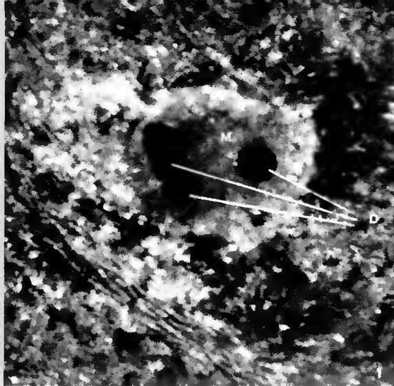
Aspect macroscopique d'un sore de Melampsora populnea (M) colonisé par trois pycnides de Darluca filum (D)