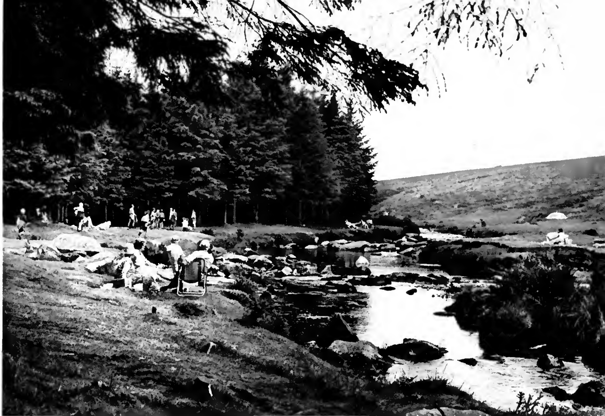
Les loisirs en forêt : la majorité des massifs forestiers britanniques ont cet âge (Dartmoor)