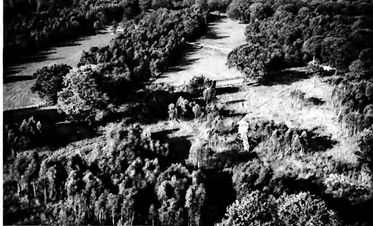
Cultures à gibier, sentier de visite, miradors