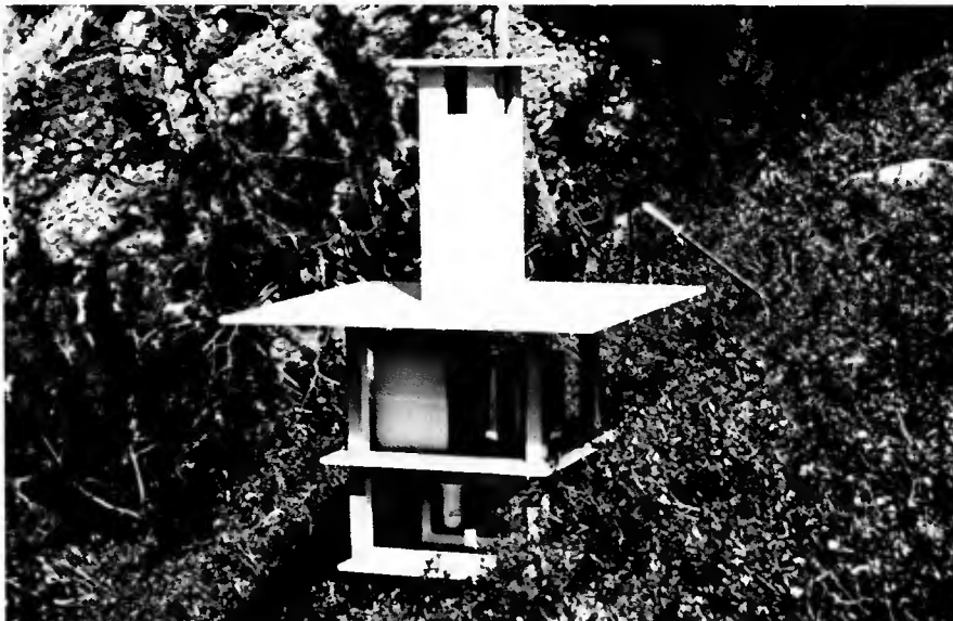
Une des quatre stations écologiques établies dans le massif de l'Argenters-Mercantour : la station du Pin mugo

D'autre part, afin que l'interprétation des enregistrements obtenus soit la plus claire possible, les emplacements choisis pour les stations présentent à peu près les mêmes caractéristiques. Ils sont notamment situés sur des versants dont l'altitude et l'exposition sont très voisines, ce qui atténue considérablement les différences de température directement liées à ces deux facteurs, lesquelles pourraient être très importantes si ceux-ci étaient très dissemblables. Ainsi, (voir en annexe), la dénivellation entre la station la plus élevée (station du Mélèze : 2 110 m) et la station la plus basse (station du Pin mugo : 2 030 m) n'est que de 80 m ; le gradient moyen de la température étant de 0^{\circ}55/100 m dans les Alpes, on voit que la différence de température, en rapport avec l'altitude, n'atteint pas un demi degré ( 0^{\circ}44 ) entre ces deux stations extrêmes.