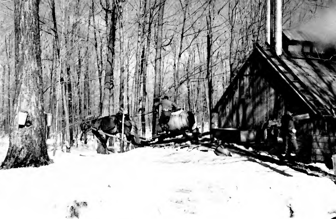
La cabane à sucre au milieu de l'érablière