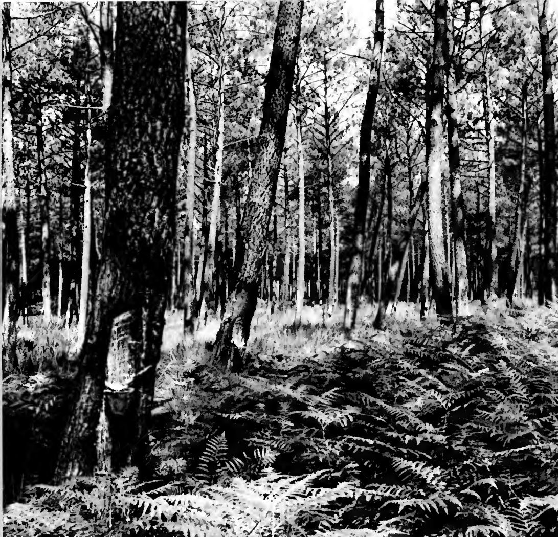
Pine en gemmage activé