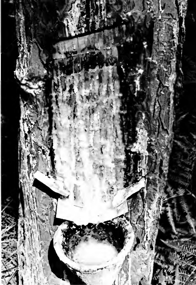
Le brunissement observé au haut de la cône est provoqué par la pulvérisation de la solution d'acide sulfurique