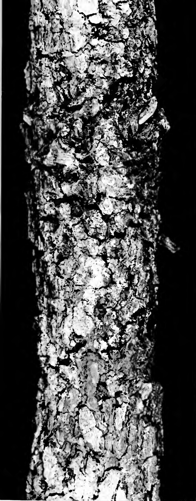
Pin maritime attaqué par Cronartium flaccidum : détail de la zone portant les fructifications de la rouille