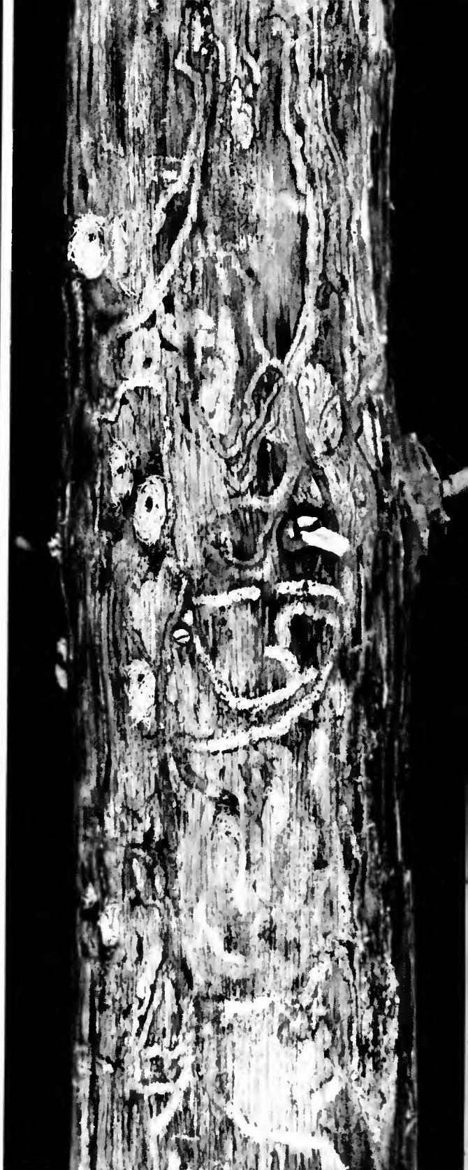
Pin maritime attaqué par Pissodes notatus : détail d'une zone montrant les galeries larvaires et les berceaux de chrysalide de l'insecte, visibles après écorçage du tronc