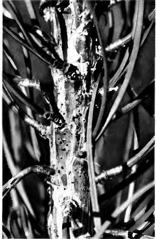
Pousse terminale de pin portant des morsures nutritives d'adulte de Pissodes notatus