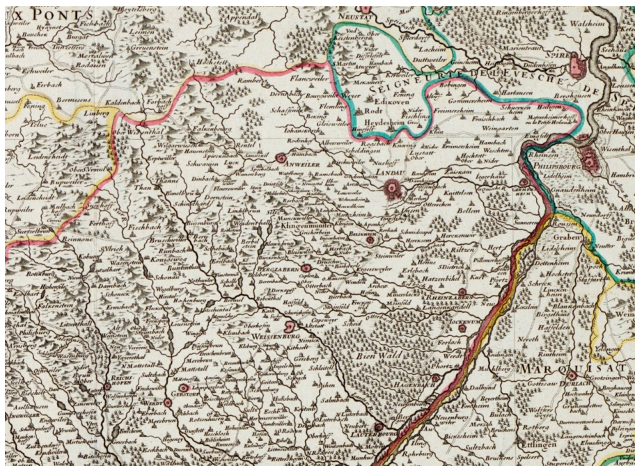
Fig. 1. La limite franco-impériale selon A.-H. Jaillot en 1707.

s'appuyer sur les travaux antérieurs qu'ils compilent et précisent au gré de leur accès à de nouvelles sources, incluant les cartes de leurs homologues, pourraient expliquer la différence. Quant aux cartographes hollandais, allemands, italiens, tous semblent conserver la Lauter ou ses environs comme ligne de référence pour distinguer les terres impériales des possessions françaises 13 .