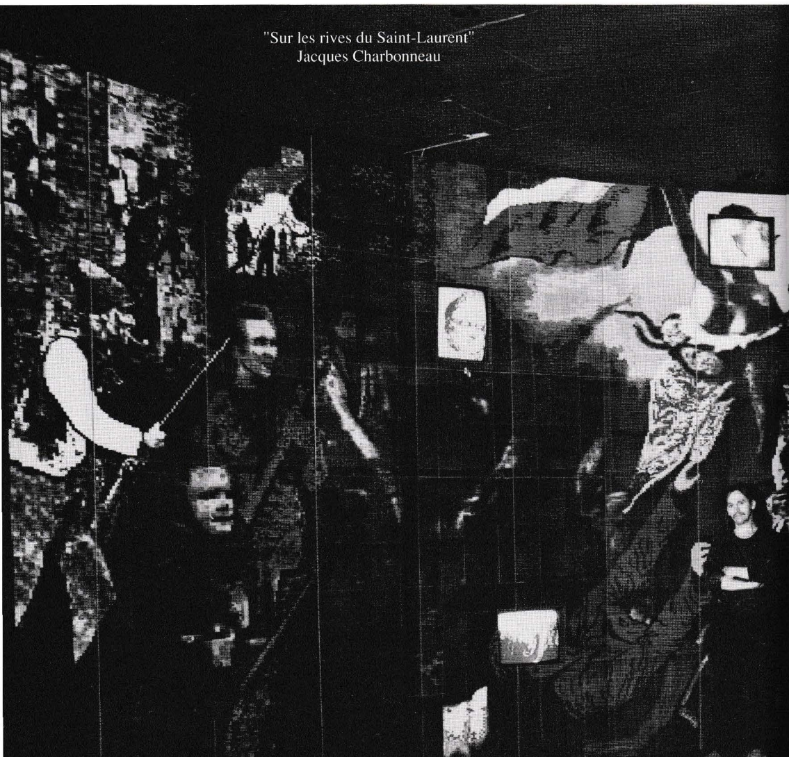
"Sur les rives du Saint-Laurent" Jacques Charbonneau

Sise dans un hangar désaffecté du Vieux-Port québécois, la cité présente chaque année depuis 1986 une exposition internationale grand public où l'art recule ses frontières traditionnelles en forgeant de nouveaux liens avec la science et les communications.