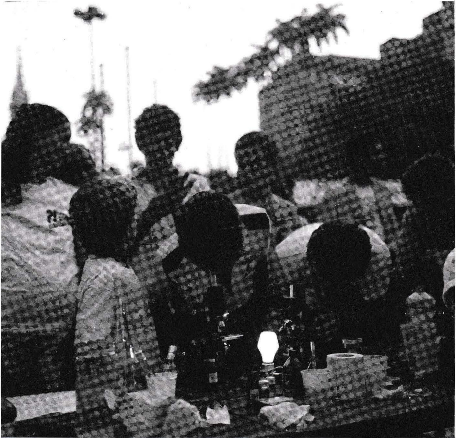
Largo do Machado - Rio de Janeiro

Lune. Et un employé de voirie peut commenter à son collègue : «Moi, j'y crois pas qu'ils sont allés là-haut. Ils ont monté ça à la télévision». De temps en temps, un moniteur déjà plus pédagogue installe un spot lumineux sur une table, distribue deux grosses boules en plastique et propose que l'une d'entre elles représente la Terre, et l'autre la Lune. Le spot est le Soleil. Où sommes-nous, cette nuit, sur cette boule ? Que voyons-nous de la Lune, vue d'ici ? Et quand viendra l'aube ? Et demain ? Et dans un mois ? Et ? Et... ? Et l'on discute, et l'on bouge ; et les gens commencent cette danse de l'univers , ce soir même.