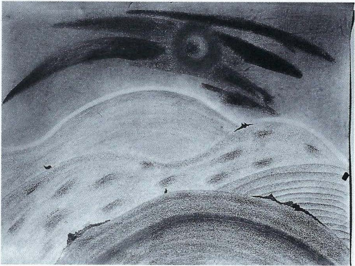
André Verdet, "Des astres solaires pris dans un mouvement circulaire" (dessin)