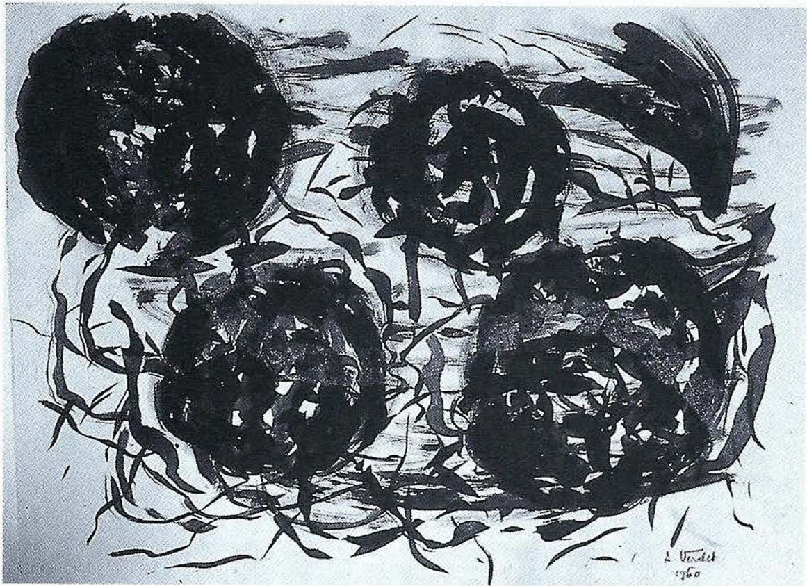
André Verdet, "Les Ciels de Provence et le soleil" (dessin)