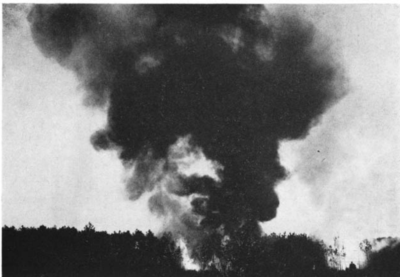
Un foyer d'incendie se déclare.