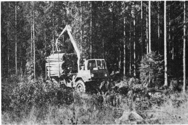
Image classiqué de l'exploitation forestière en Suède.