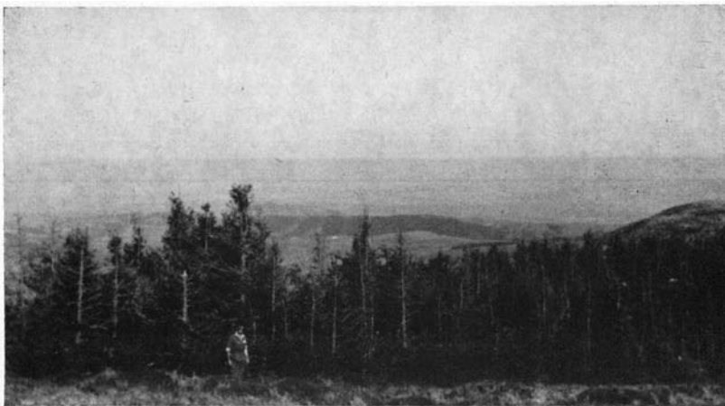
Pessière du Cézallier, âgée de 100 ans, prise du sommet (1 540 m).

Ici, notre optique est très différente, car seul, le massif de Sancy, et, très partiellement, celui du Lioran, ont une vocation hivernale. D'ailleurs, dans ces massifs, le programme ci-dessus est entièrement applicable.