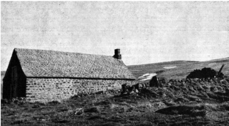
Buron en ruines et buron en exploitation à Parrot (1 330 m). Au fond, les pessières du Cézallier (1 550 m).

Le Service des Eaux et Forêts ne s'est occupé qu'accessoirement de travaux R.T.M. en Auvergne.