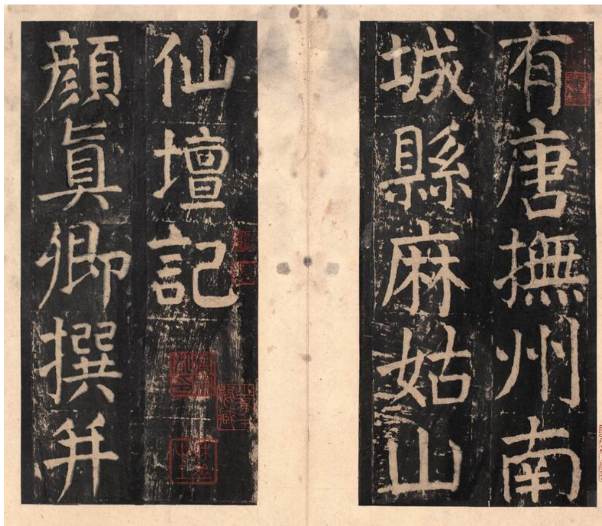
1. Yan Zhenqing (708-785), Annales de l'Immortelle Magu , 771, détail d'un estampage des Song, Pékin, musée de l'Ancien palais

chaumière sur le mont Lu par Deng Shiru (1743-1805), datant de 1804 (ill. 2), en écriture sigillaire. En peinture, de toutes les œuvres de l'artiste, c'est le rouleau Habiter les monts Fuchun ( Fuchun shanju tu ) de Huang Gongwang (1269-1354), réalisé entre 1347 et 1350 (ill. 3), qui est préféré pour l'apprentissage des « montagnes et eaux » ( shanshui ), expression qui désigne le paysage pictural et littéraire.