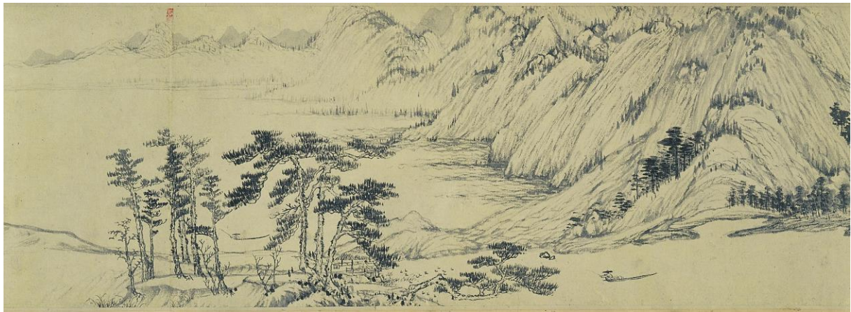
3. Huang Gongwang (1269-1354), Habiter les monts Fuchun , 1347-1350, détail, Taïpei, musée national du Palais.

D'emblée, on peut retenir deux points essentiels : premièrement, l'art est un moyen de parfaire sa personnalité, au cours d'un processus qui dure toute la vie et que la vieillesse n'interrompt pas ; deuxièmement, la vieillesse n'est pas considérée comme moins créatrice que l'âge mûr, bien au contraire, c'est à un âge avancé seulement que s'acquiert la liberté créatrice, considérée comme l'idéal suprême.