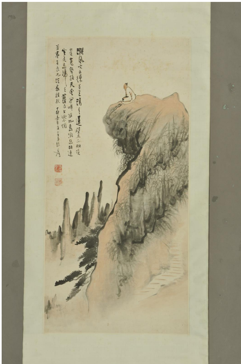
5. Zhang Daqian (1899-1983), Montagne, eau et personnage, encre sur papier, musée d'Art de Pékin.

Gao Qipei oppose ainsi deux styles picturaux : méticuleux et suggestif. Le style méticuleux est souvent attribué aux professionnels et académiciens, aux artisans,