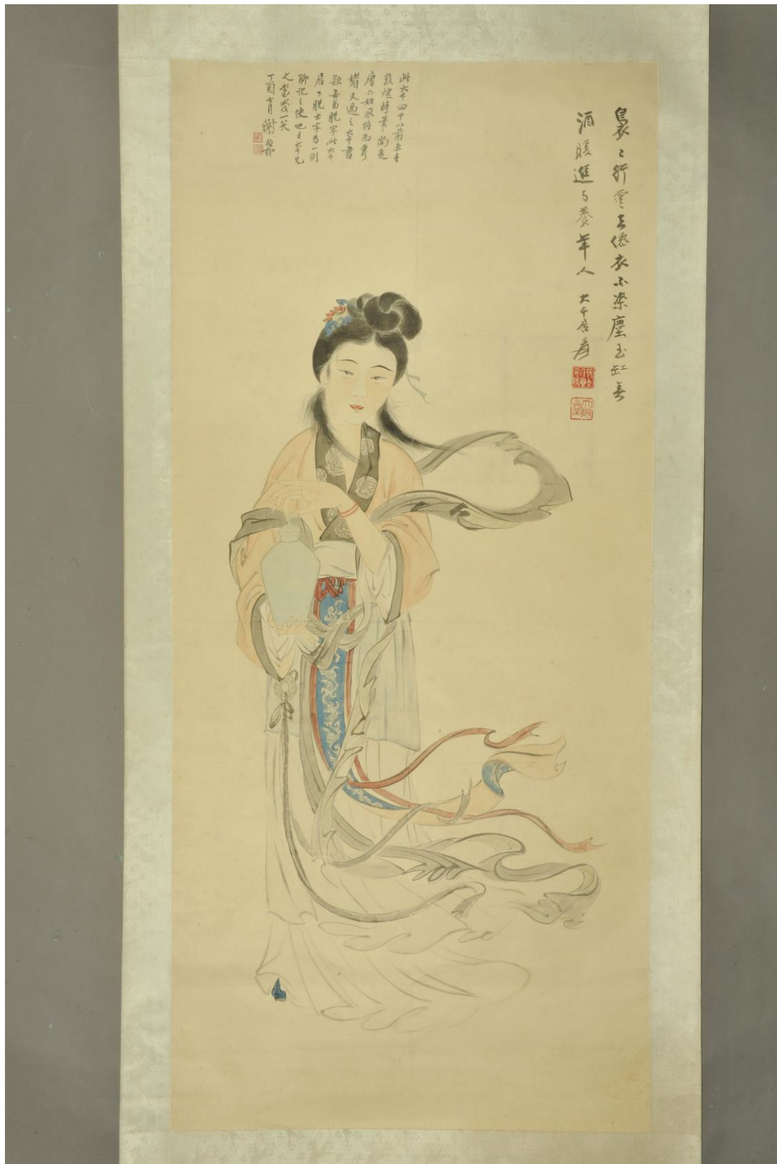
4. Zhang Daqian (1899-1983), Figure féminine , encre et couleurs sur papier, style minutieux, musée d'Art de Pékin. Avec l'aimable autorisation du musée des Beaux-Arts de Gaillac.