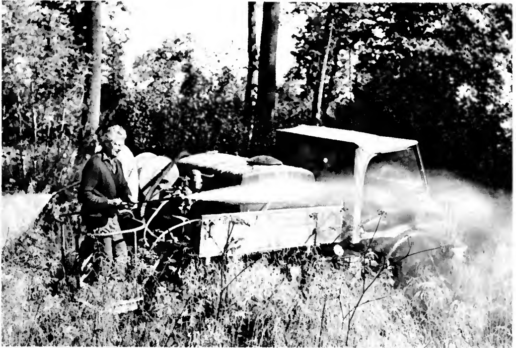
PORT-SUR-SAONE. Dégagement d'un enrésinement effectué sur bandes : pulvérisation à l'aide de deux lances (en recherchant une répartition homogène de la bouillie)

la grande fétuque et la luzule blanchâtre. Des doses supérieures de l'ordre de 15 kg devraient être envisagées pour la canche flexueuse, mais une étude précise de l'installation des semis n'a pas été faite dans ces conditions.