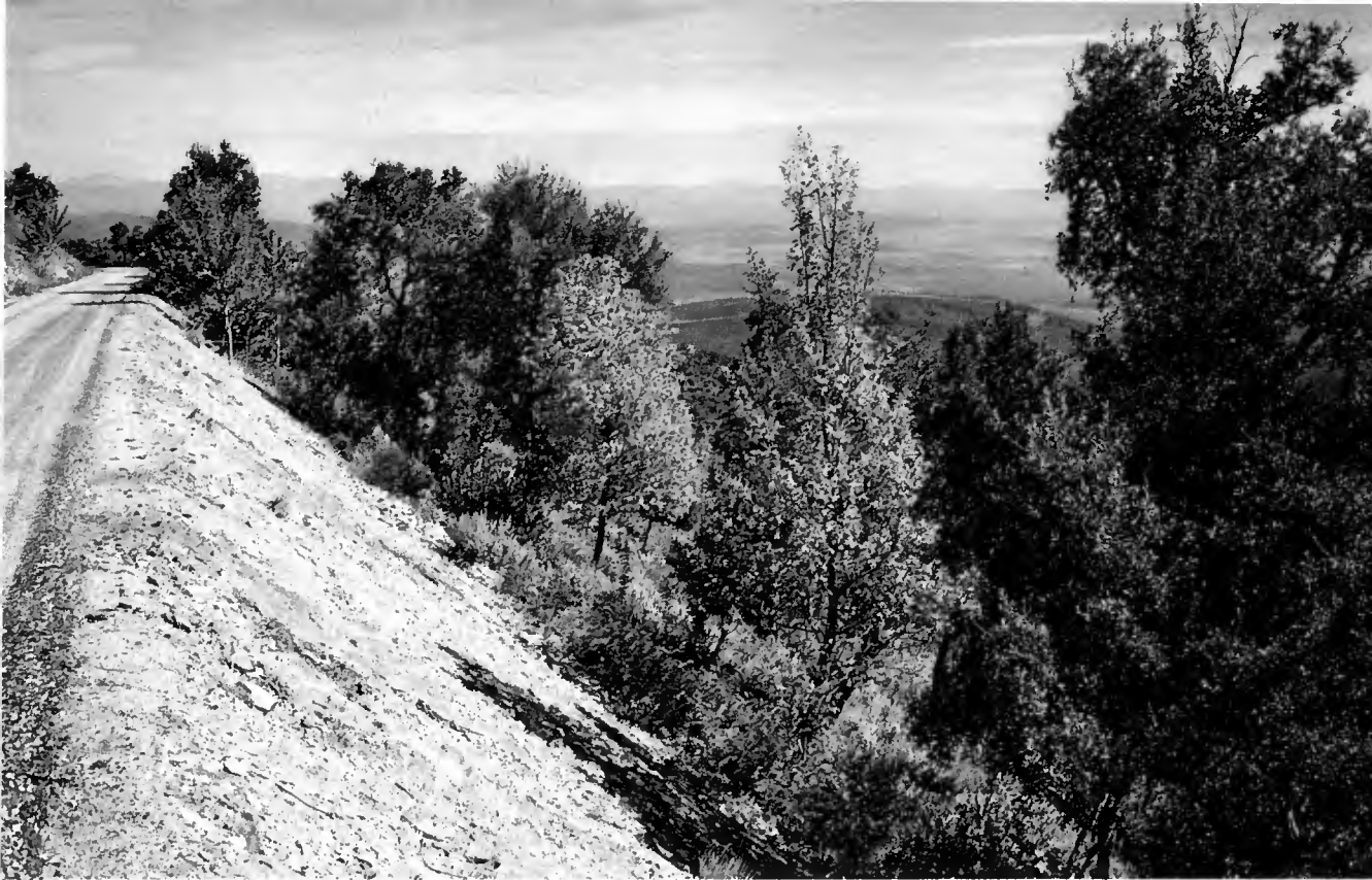
Route D.F.C.I. des Treps (Var). Essai de débroussaillage chimique en bordure de route : pulvérisation annuelle de bouillies suivi d'un recépage la première année — Etat au 10-5-69