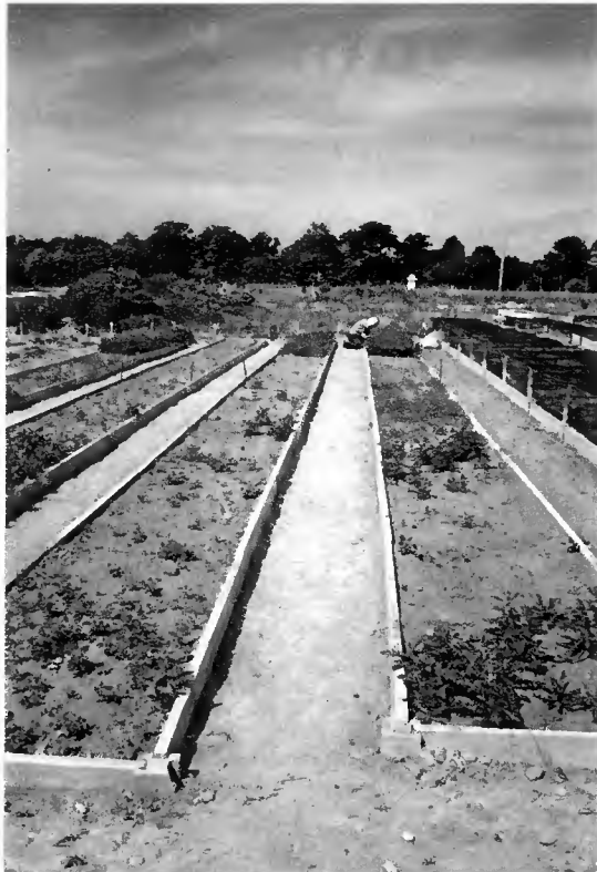
PÉPINIÈRE D'AMANCE (C.N.R.F.). Essai d'efficacité herbicide (sans semis). Successivement en s'éloignant du 1 er plan :

Les temps indiqués pour les désherbages sont très approximatifs, le dénombrement des adventices étant effectué au cours de l'arrachage. Les compositions floristiques ayant évolué