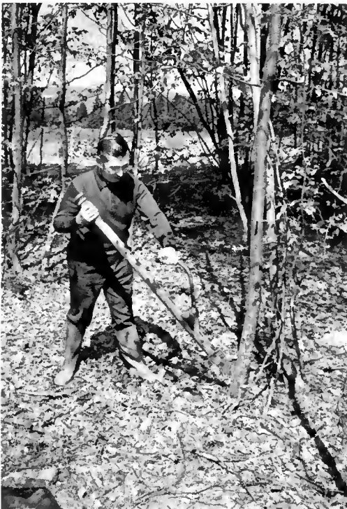
FORÊT D'AMANCE. Mise en œuvre de la hachette-injecteuse (Ansul) : l'écoulement du cacodylate se fait aussitôt l'entaille réalisée. Remarquer la visière de motocycliste et les gants