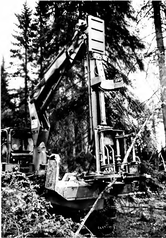
Abatteuse KOCKUM

plutôt que d'y faire des éclaircies. D'autres envisagent de supprimer systématiquement les coupes d'amélioration dans les peuplements en croissance, la gamme des diamètres recherchés par l'industrie étant obtenu en rasant les peuplements à un âge plus ou moins avancé.