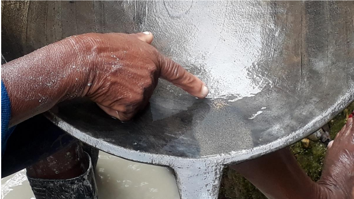
Figure 3 : Trouver de la poussière d'or dans la batea . Photo : Sandrine Revet, mai 2019.

Pour autant, il est également indéniable que l'arrivée massive des techniques d'extraction mécaniques sur le fleuve dans les années 2000 a provoqué des transformations importantes des modes de vie, entraînant une dégradation progressive du bassin et une exposition non négligeable de la population à la contamination au mercure 33 . Le mercure a de graves conséquences sur la vie des habitants : problèmes respiratoires, maladies de peau, malformations chez les bébés. La pollution au mercure a fait disparaître une grande partie des espèces de poissons, principale nourriture des habitants, et a contribué à la disparition de certaines plantes et de légumes consommés localement, avec pour conséquence des changements profonds dans les modes d'alimentation des habitants, obligés d'acheter et de consommer de plus en plus d'aliments industriels, comme le poulet par exemple, vendus dans les supermarchés de Quibdó, conduisant à un accroissement des formes monétarisées d'économie.