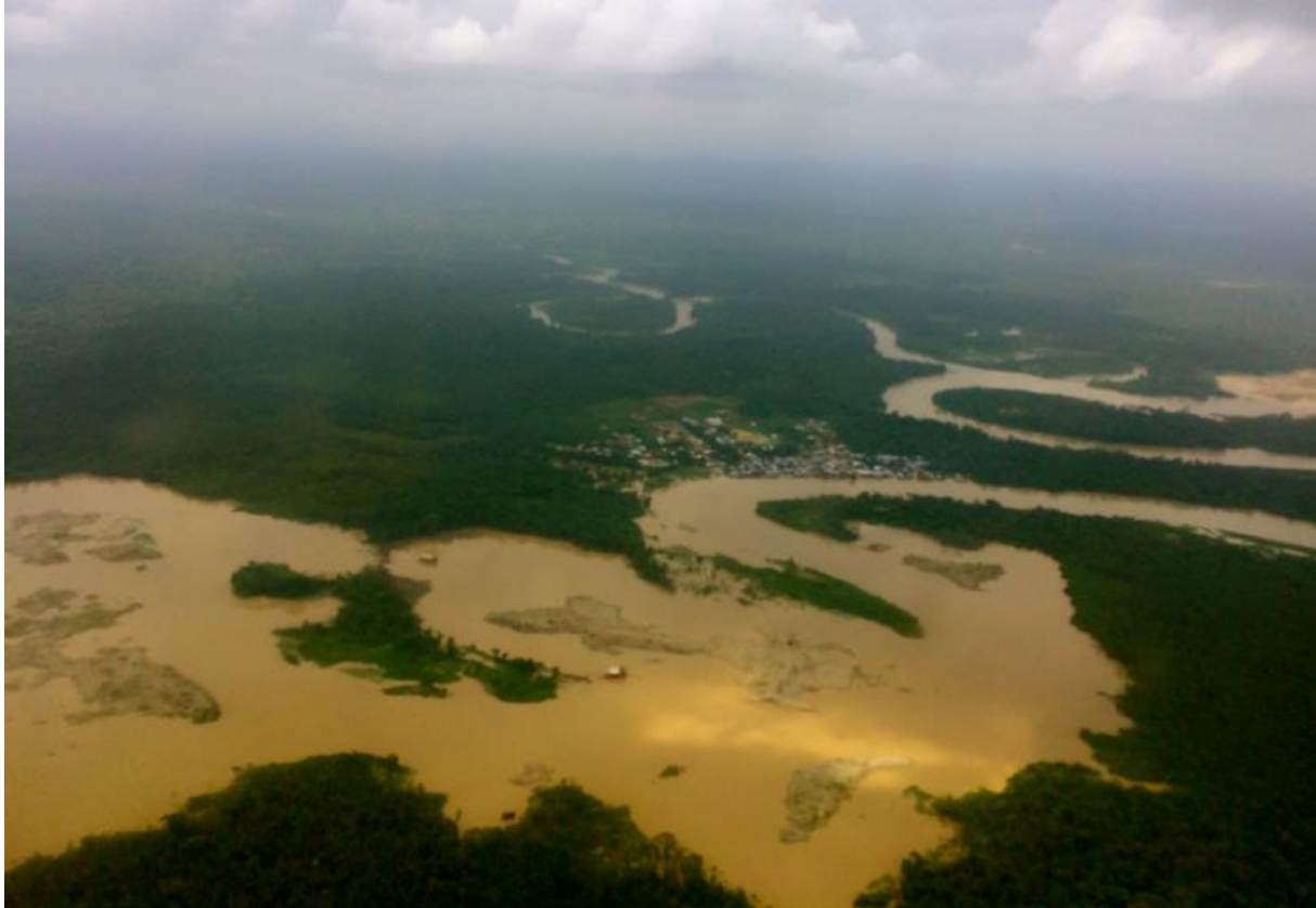
Figure 4 : Photographie du Río Quito produite dans les annexes de l'arrêt T-622 de 2016. Légendée ainsi « Photographie 136 : Destruction et pollution du lit du fleuve Quito (affluent du fleuve Atrato) ».