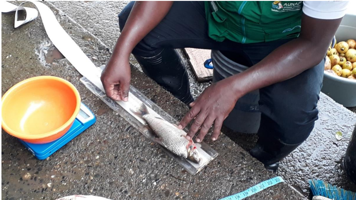
Figure 5 : Un technicien du ministère de l'Agriculture et de la Pêche mesure les poissons dans le port de Quibdo, juin 2018.

La commission des Gardiens et les experts qui travaillent avec elle vont alors cartographier non plus le fleuve, mais le bassin, soit le fleuve avec l'ensemble de ses affluents et les territoires qu'ils traversent, ce qui correspond à une surface de 3 millions d'hectares dont 2,5 millions se trouvent dans le Chocó et le reste dans le département voisin d'Antioquia. Administrativement, on parle de 39 conseils communautaires qui couvrent une surface de 1 731 549,13 hectares, mais aussi de communautés noires qui ne sont pas organisées en conseils communautaires, de communautés « métisses ou paysannes » et de communautés indiennes organisées en 64 resguardos indigenas pour une surface de 738 000 hectares (Figure 6).