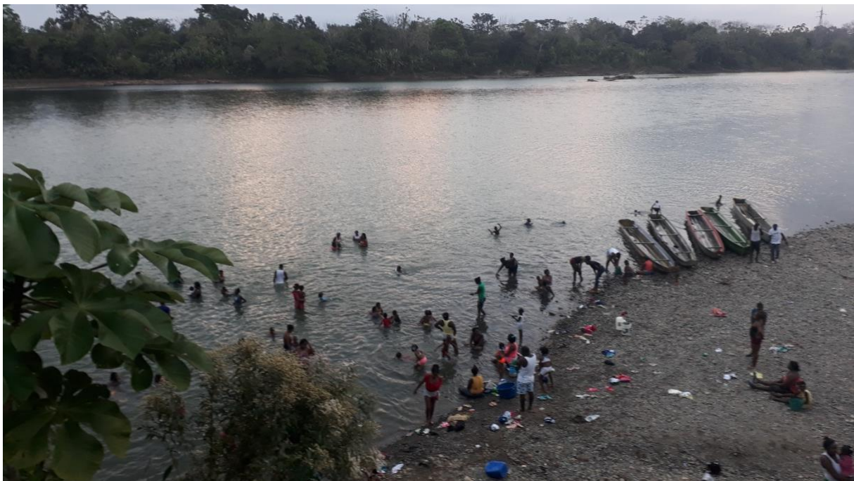
Figure 2 : Fin de journée sur le fleuve Atrato à Yuto. Photo : Sandrine Revet, 2020.

Dans le modèle de l'économie extractive depuis la colonisation, l'or et l'esclavage, puis le caoutchouc et l'ivoire végétal, le platine et toutes sortes de bois ont été alternativement des sources de revenus puisés dans le Chocó. Ces conflits autour des usages des ressources se sont particulièrement aiguisés dans les années 1980, avec l'octroi de concessions d'exploitation du bois à de grandes entreprises, donnant lieu à la mobilisation de certains secteurs paysans, appuyés par l'Église catholique à travers les missionnaires clarétains. L'intervention d'un projet de coopération technique impulsé par la coopération néerlandaise à la fin des années 1980, le projet « Desarrollo Integral Agrícola Rural » (DIAR), avec le déploiement d'activités, de moyens financiers et d'experts travaillant sur les « usages rationnels de ressources naturelles » a également permis de mettre en lumière des modes de productions locaux spécifiques, et d'introduire dans les discours des paysans mobilisés pour la défense de leur terres la notion de « territoire » 25 . La mobilisation et le processus de structuration du mouvement aboutit, avec la Loi 70 de 1993, à l'octroi aux populations noires descendantes d'esclaves du statut de communautés « ethniques » et de droits collectifs, notamment territoriaux, associés à cette identité.