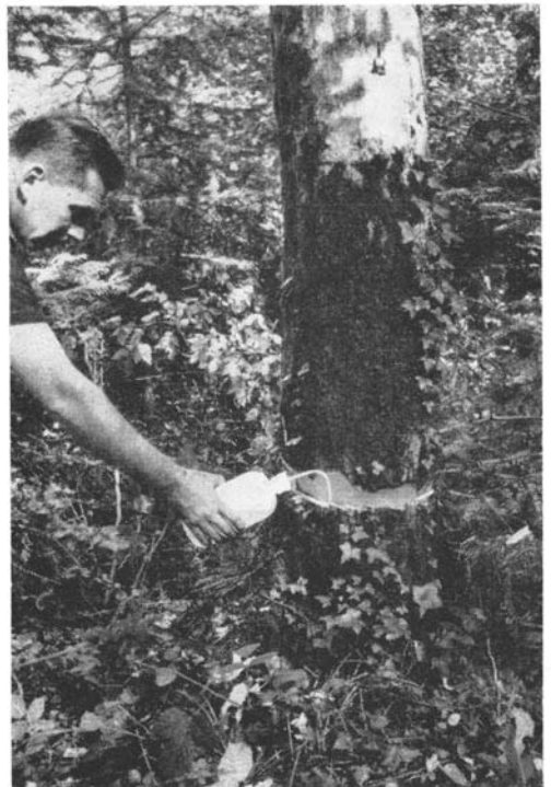
Traitement d'un gros charme par annellation — Application d'une solution de sulfamate.