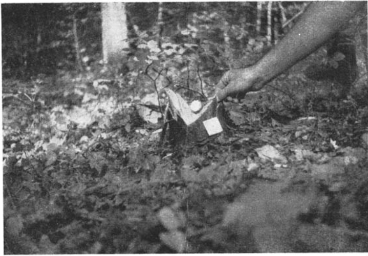
Traitement des souches — Noter la forme de la découpe.