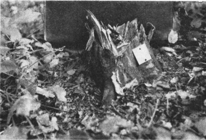
Souche traitée par sulfamate à 10 gr. (1 cuiller à café). Aucun rejet.

Pour vérifier cette hypothèse et voir si elle s'applique aux traitements d'hiver, nous avons, en février 1957, renouvelé nos expériences sur le charme mais avec 10 répétitions (au lieu de 5) en limitant à 15 g les essais de sels sulfaminés. En même temps nous avons traité à une cuiller de sulfamate, sur un hectare, toutes les petites