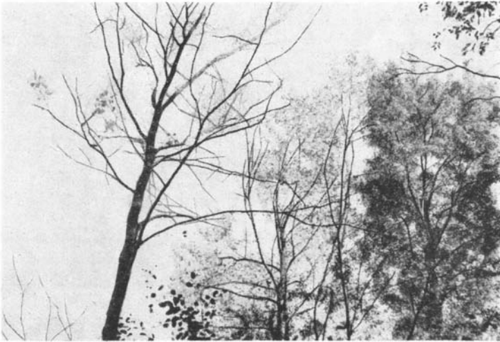
Au 1 er plan, charme traité par entailles à 20 gr. de sulfamate. Derrière (feuillage clairsemé) même traitement par sels sulfaminés.

Ceci étant, il est intéressant d'observer le résultat des traitements pour les arbres sur pied. Il faut bien admettre en effet que beaucoup de forêts, dont l'enrésinement est souhaitable, se trouvent dans des régions d'accès difficile où l'exploitation — et le débardage —