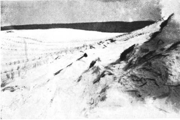
Vue d'Ouest en Est: A la suite du manque d'entretien, la dune a repris son mouvement vers la forêt. A droite: hauteur de la dune normale. Au centre: piquet mar- quant le point Km 20. A gauche: plantation de Gourbet.