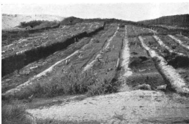
Palissades et Sillons Partie exploitée par les troupes d'occupation (abatage à 1 m au- dessus du sol). Au 1 er plan : garde-feu n° 24. Reboisement 6 e Série division 8