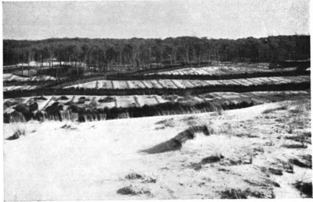
Deux trouées après re- boisement (Vues pri- ses de la dune). Sillons Est-Ouest 6 e Série division 13 Travaux 1950