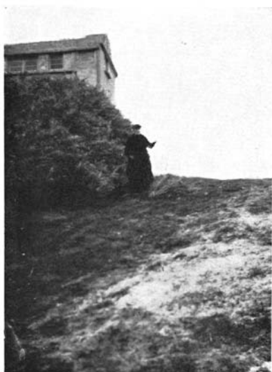
Haie d'atriplex Hauteur : 2,50 m Garde-feu n° 29 L'ouvrière prépare des boutures