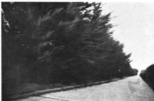
Haie de cyprès de Lambert. Hauteur des arbres : 6 à 7 m. Étalement des ramifications vers l'Est