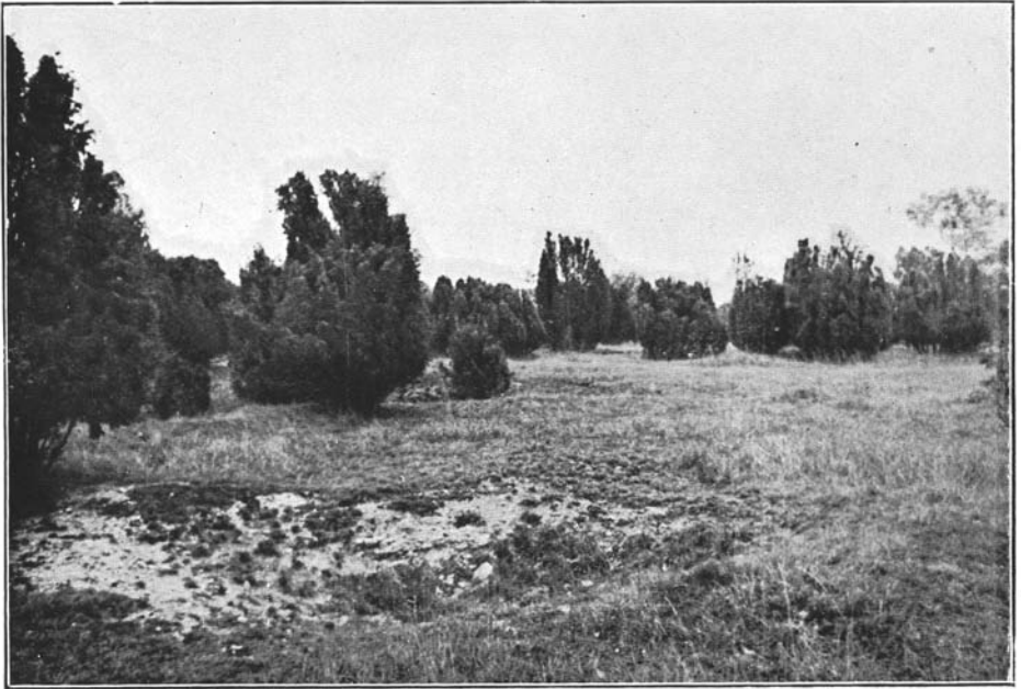
Pelouse à graminées xérophiles et génévrier sur rendzine typique.