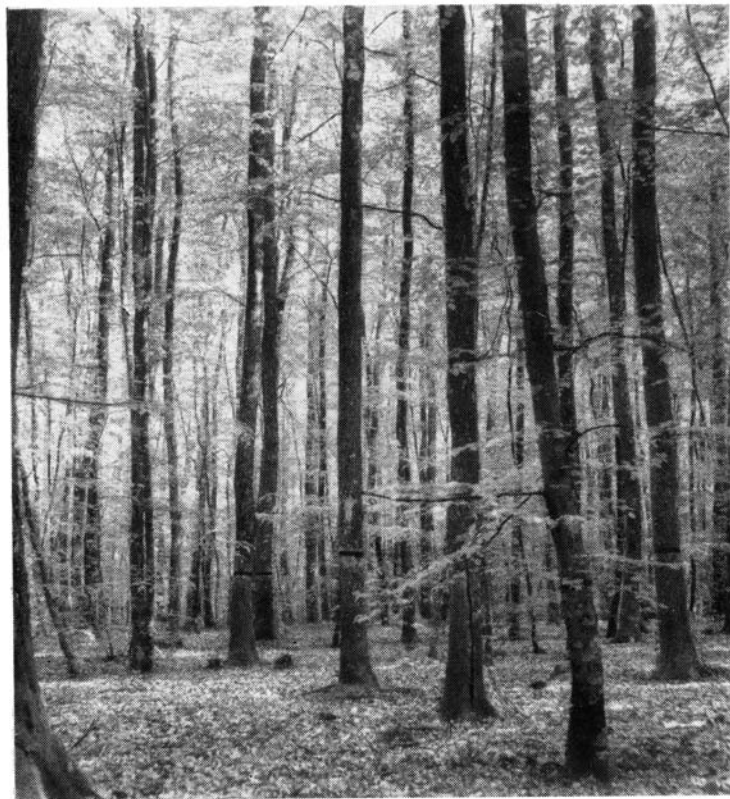
Forêt domaniale de Moladier. - Canton de Goutte- Noire. - Parcelle E1 Haut perchis où les arbres d'éli- te ont été ceinturés.