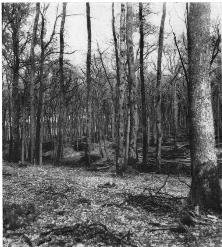
Forêt domaniale de Gros- bois. - Canton de Saint- Fiacre. Parcelle M3. Coupe d'ensemencement.