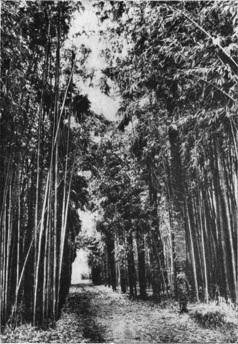
Palmiers et bambous - Domaine de Prafrance.