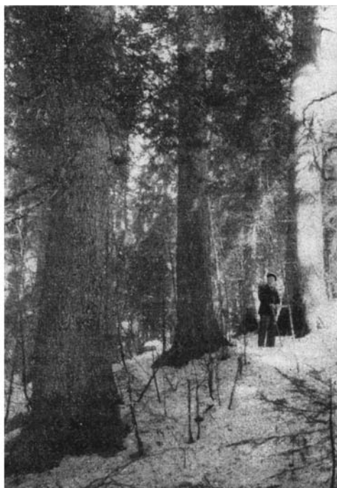
12 e série du Couvent.

On sent cependant, à une observation attentive, combien tout ce reste de beauté naturelle est précaire. Il suffit, pour s'en convain-