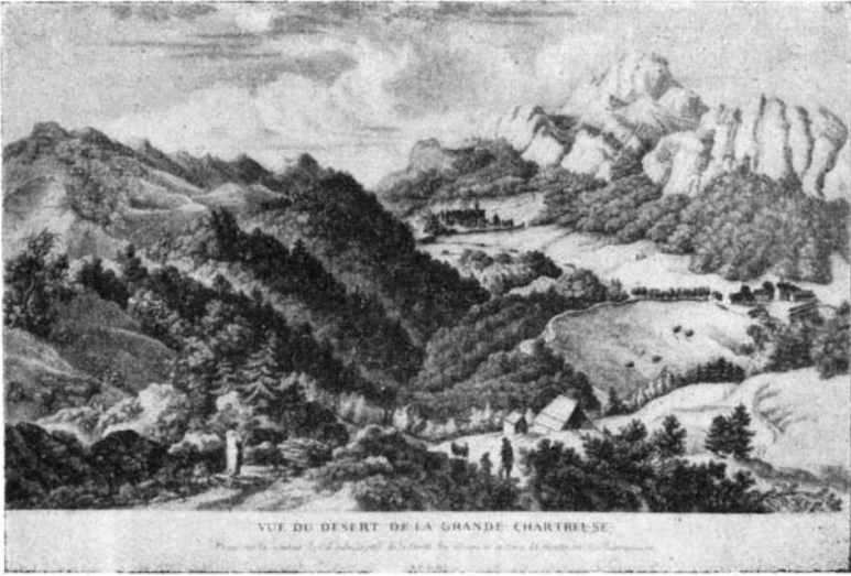
Vieille gravure représentant à la fois la Correrie et la Grande Chartreuse