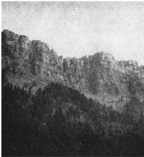
Falaise urgonienne dominant la forêt de Chartreuse.

La richesse de la faune entomologique a pu faire souhaiter la constitution de réserves biologiques limitées pour la protection de certaines espèces rarissimes. Rien n'a été fait à ce sujet, mais les réserves artistiques pourront jouer un rôle utile à cet égard sans qu'il y ait contradiction avec leur but essentiel.