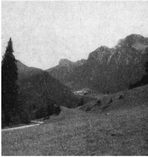
La Prairie de Valombré. Au deuxième plan, le Monastère et le Grand Som.