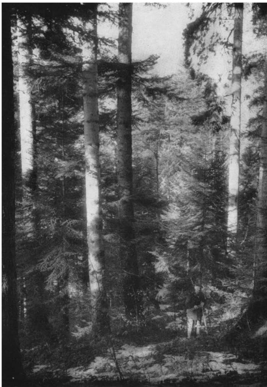
12 e série (Série du Couvent).