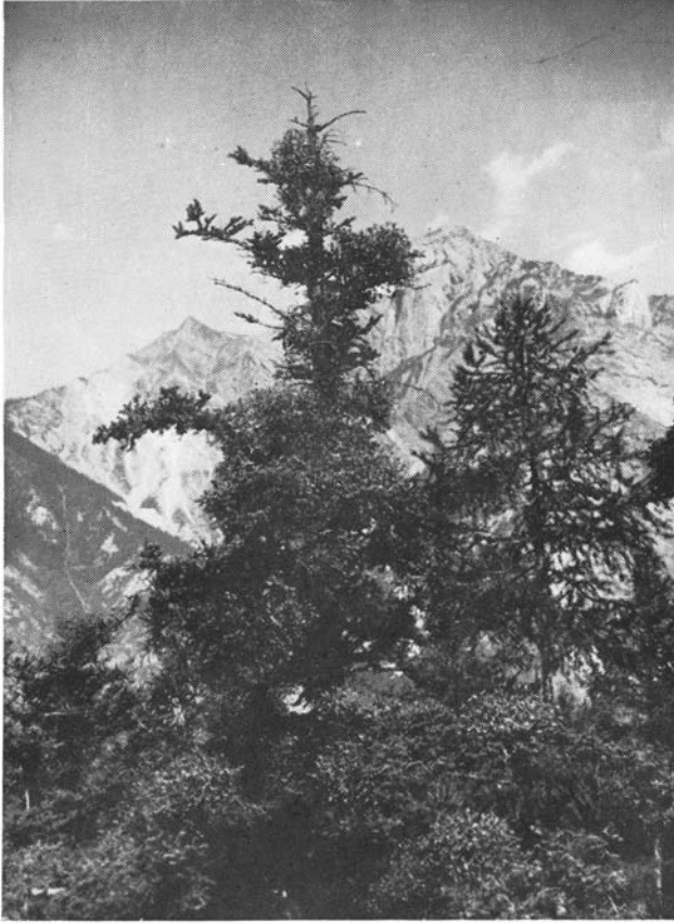
Sapin « guité » et mélèze en forêt de St-Martin d'Arc (Savoie). Dessèchement de la cime.