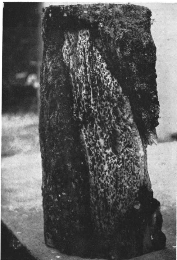
Chute de l'écorce dans un cas d'invasion massive du gui. Blessure dangereuse. Forêt communale de Bevaix (Neuchâtel).