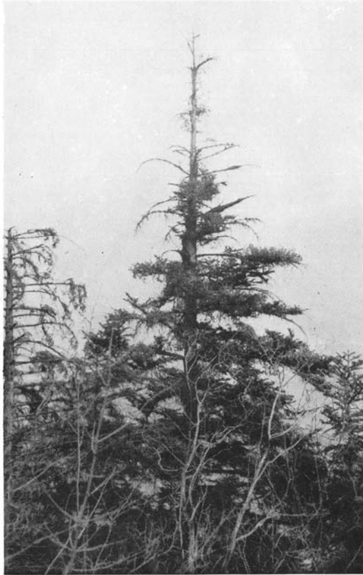
Gui sur sapin. Dessèchement de la cime. Remarquer les touffes de gui encore vertes. Forêt communale de Grignon (Savoie).