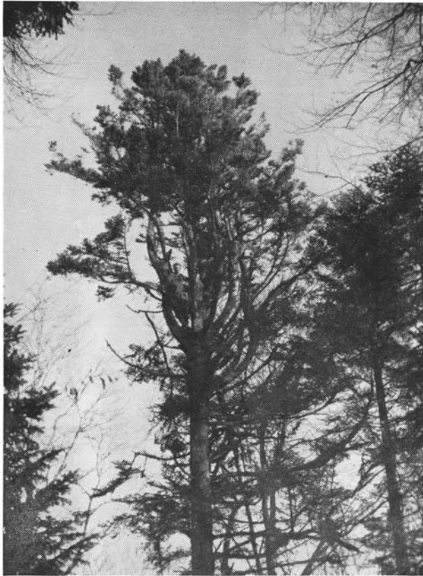
Sapin dont le fût se termine par une magnifique cime multiple due au gui. Forêt communale de Bevaix (Neuchâtel).