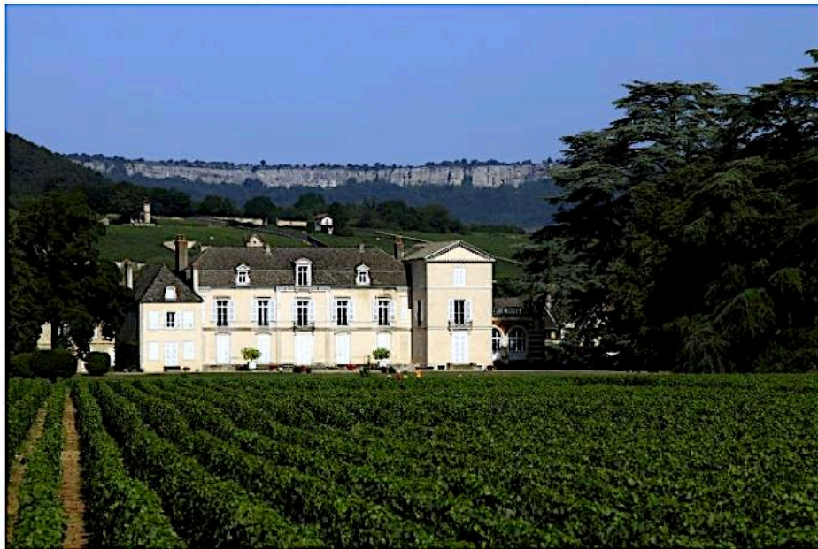
Le Château de Meursault (Bourgogne), un domaine dont l'architecture remaniée au début du XIXe s. se nourrit du château bordelais. [1] [SEP]