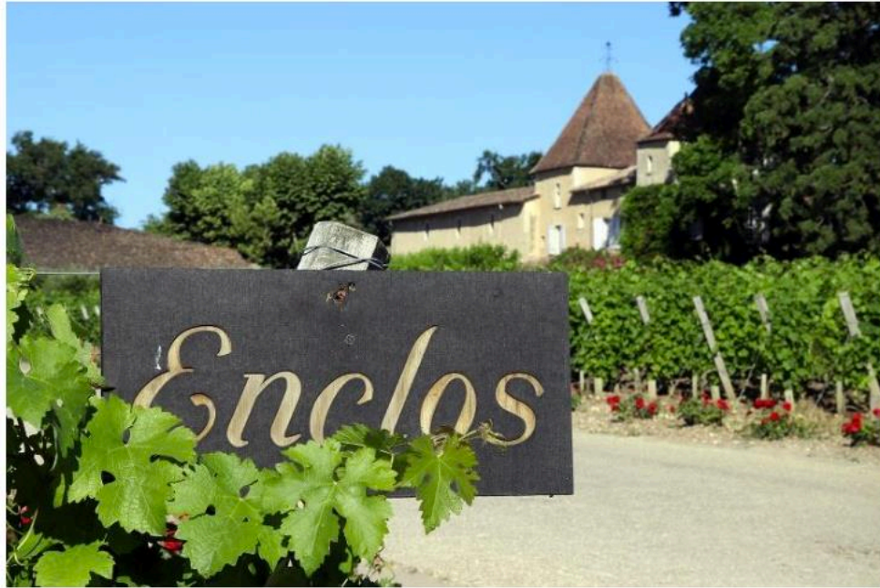
L'Enclos, parcelle du Château Carbonnieux (Léognan). La logique du domaine prime sur celle des parcelles en Gironde. [1] [SEP]