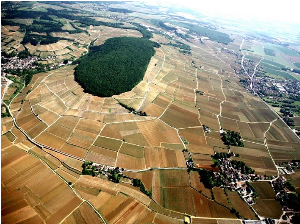
illustration 2 : Vignoble morcelé et parcellaire des climats de la butte de Corton (Côte de Beaune), photo: association Paysage de Corton.

Elle a consacré un paysage qui représente par son morcellement, une multitude de lieux différents – les climats – dont la délimitation, les conditions atmosphériques qui y règnent, les sols, la pente, l'exposition des versants mais aussi les pratiques et les trajectoires historiques sont vus comme les déterminants de la diversité et de la hiérarchie des vins qui en sont issus. Le dossier a dénombré 1247 climats demandés à l'inscription, donc 1247 lieux qui produisent autant de vins différents sans compter la diversité apportée par les différents producteurs et les itinéraires techniques de conduite de la vigne, de vinification et d'élevage du vin en cave. Ce sont autant de noms de lieux particuliers qui peuvent être revendiqués par les vins, dans la mesure où les cuvées sont séparées par lieux sans assemblage parcellaire. Ils se distribuent dans les 4 niveaux d'Appellations d'Origine Protégées reconnues par l'INAO au XX e siècle : appellations régionales (par exemple : Bourgogne), appellations villages (par ex. Morey-Saint-Denis), parmi celles-ci, les dénominations géographiques 1 er crus (par ex. Morey-Saint-Denis 1 er cru Monts Luisants) et enfin les appellations grands crus (par ex. Le Montrachet) 1 .