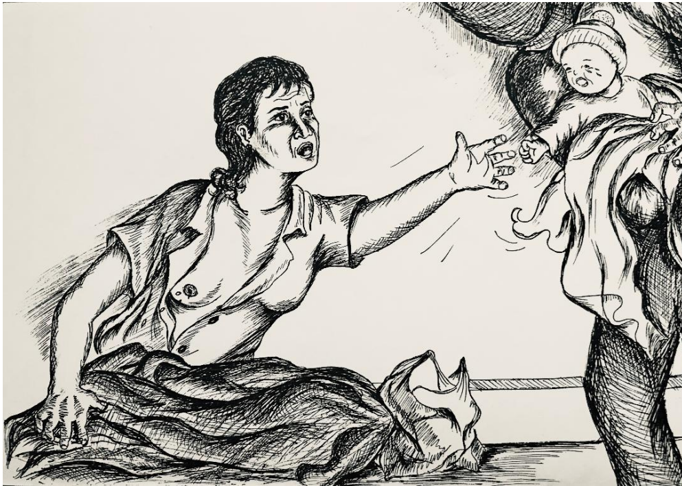
“No me reconocía como su madre”

La representación pictórica de esta separación nos habla tanto más de humanización de la madre prisionera cuanto que el relato insiste sobre los objetivos deshumanizantes y las representaciones estigmatizantes del Estado sobre las mujeres-madres del PCP-SL: