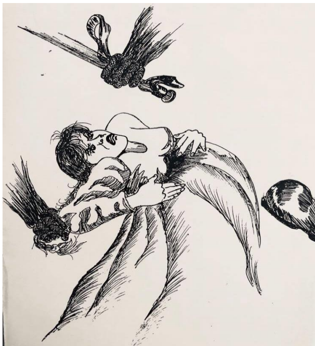
“Nacido en la adversidad”

Al momento del nacimiento, siguieron los maltratos, las humillaciones, la indolencia y el cinismo de parte de la policía penitenciaria, lo que tuvo consecuencias negativas sobre la salud del bebé —víctima al nacer con edema occipital derecho—, pero también positivas de parte del personal médico de la maternidad y de las prisioneras por su solidaridad. El periodo posterior no impidió que siguieran los tratos degradantes y crueles, no sólo hacia ella sino también hacia otras prisioneras embarazadas: