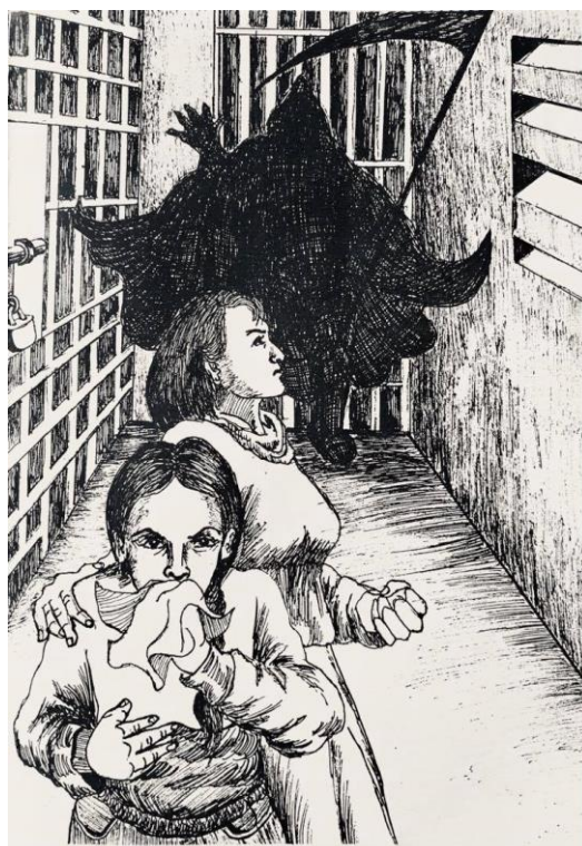
Tienes pulmones pa' regalar

- Tienes pulmones pa' regalar es el testimonio que analizaré en segundo lugar, tratándose esta vez de las condiciones de salud de las prisioneras durante el encierro y del deterioro de la misma como método de guerra aplicado por las autoridades, además de las diversas torturas directas practicadas contra la narradora al momento de su detención en 1993. Este relato trata, en suma, de la politización de la enfermedad y, de manera amplia, de la politización del cuerpo en clave femenina, siendo éste, aquí por lo menos, doblemente cautivo, por la enfermedad y por el régimen carcelario. El testimonio tiene una dimensión no solo autobiográfica, sino también colectiva y no siempre anónima, al describir los problemas de salud que afectaban al conjunto de internas del PCP. Esta doble dimensión es la que guía el esquema narrativo del texto, al alternarse la voz individual y la voz grupal, un Yo que abre y un Nosotras que cierra el relato.