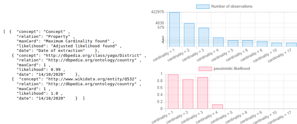
FIG. 2 – Liste des contraintes au format JSON et représentation visuelle d'une contrainte

Lorsque l'utilisateur lance l'exécution, le serveur vérifie que la propriété est bien présente dans la base de connaissances cible. Si ce n'est pas le cas, un message d'erreur est retourné à l'utilisateur, sinon l'implémentation partielle de l'algorithme C3M effectue son traitement. L'application gère aussi différents types d'erreurs tels que les erreurs provenant des points d'accès SPARQL ou encore s'il n'y a aucune contrainte significative détectée car pas assez d'instances pour cela dans la base. Une fois l'exécution terminée le serveur retourne une liste, au format JSON, de contraintes de cardinalité maximale chacune associée à une classe avec ses paramètres associés (voir la partie gauche de la figure 2 qui présente un extrait du résultat pour la propriété dbo:country ). Ces résultats sont affichés à l'utilisateur sous forme d'une liste (voir la figure 1 à droite) et l'utilisateur peut avoir le détail pour une contrainte. Par exemple, la figure 2 (à droite) présente, pour chaque cardinalité, l'histogramme des individus (en bleu) et le taux de cohérence pessimiste (en rouge).