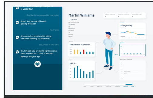
Figure 3: Écran de l'interface regroupant l'ensemble des informations concernant le patient et ses interactions avec l'assistant

Les utilisateurs peuvent suivre leur propre historique de santé généré par la conversation avec l'assistant vocal pour répondre plus facilement aux questions (Figure 3). Ils pourront également suivre cinq symptômes clés qui les encourageront à consulter un médecin si besoin (fatigue, limitation d'activité, congestion, œdème, essoufflement). En outre, les données sont directement partagées avec les équipes médicales pour assurer une réponse rapide aux personnes en mauvaise santé. Les données ne sont accessibles qu'aux utilisateurs et à l'équipe médicale autorisée et stockées sur des serveurs hospitaliers sécurisés.