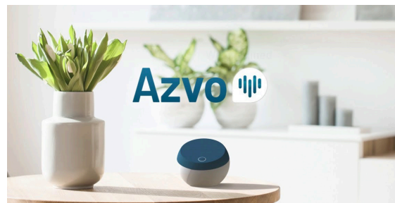
Figure 1: Illustration d'une incarnation de l'assistant vocal imaginé par les designers de frog

Azvo prend la forme d'une enceinte connectée accompagnant les patients dans leur vie quotidienne (Figure 1), mais ce projet est avant tout un système complet de suivi et de soutien à l'éducation thérapeutique 1 . Le défi consistait à toucher davantage de patients et à transmettre de meilleures données aux médecins. En effet, vivre avec une insuffisance cardiaque implique de modifier son régime alimentaire, ses habitudes d'exercice et de surveiller constamment certains symptômes. Les médecins souhaitent inciter davantage de patients à changer leurs habitudes tout en suivant leurs progrès en dehors de l'hôpital, prenant le parti qu'une utilisation régulière permet d'obtenir de meilleures données et donc d'améliorer les soins.