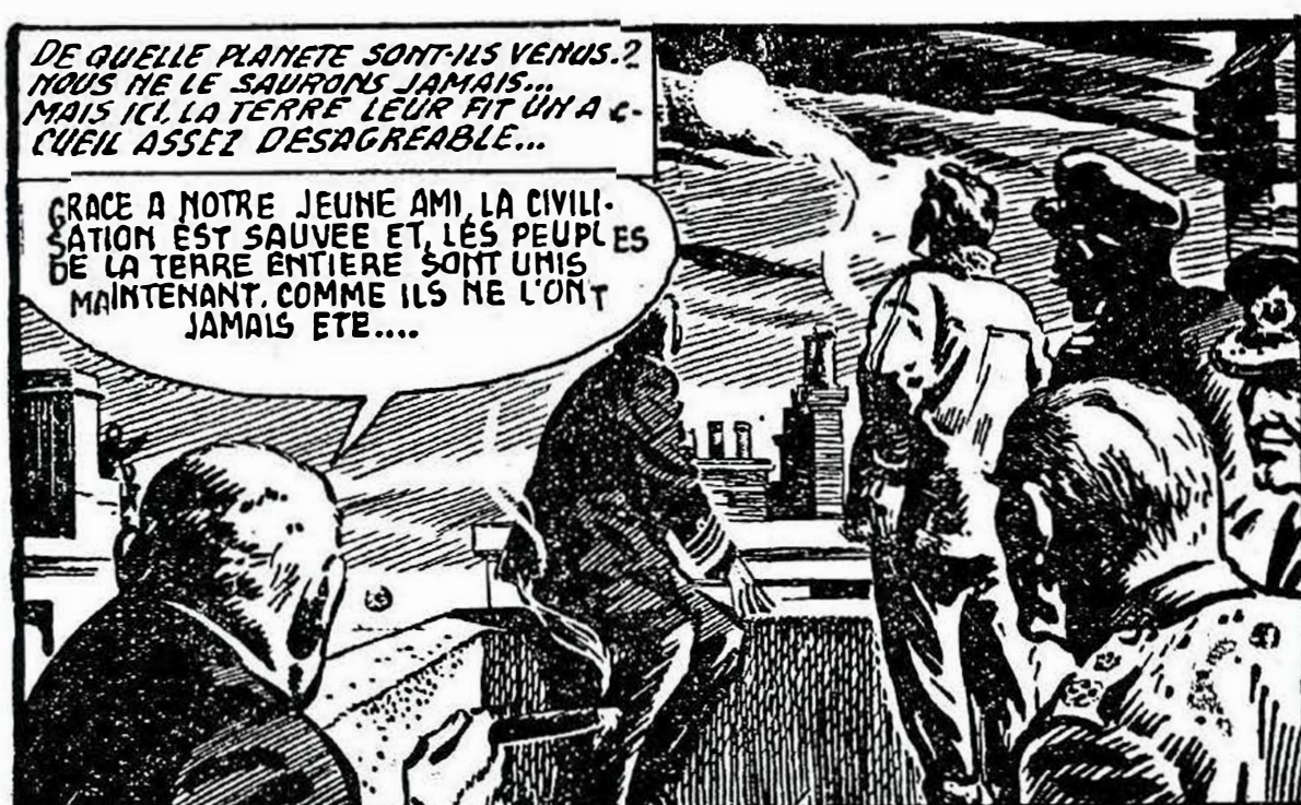
Illustrations tirées du magazine "Aventures de demain", Editions Mireille, mars 1956

Peut-être parviendra-t-on un jour à lancer des projectiles sur la Lune et même au-delà ; quant à embarquer et faire vivre des passagers à leur bord, réaliser en fait une véritable navigation interplanétaire... c'est là une tout autre histoire. L'homme est présomptueux. Il oublie souvent qu'il n'est pas qu'un pur esprit ; qu'il est l'esclave d'une organisation biologique d'ensemble dont le cerveau, générateur d'intelligence et de pensée, n'est qu'un constituant limité ; Vivant et agissant en dehors de sa conscience et de sa volonté, cette organisation ne saurait se plier, à tous les caprices de son imagination et de son génie.