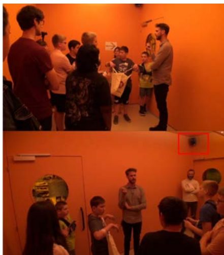
Fig. 6 – Exposition Prison, atelier webradio «Reporter au musée» au MICR de Genève, le 02.07.19.

D'une part, dans une pièce totalement orange dont la surface est légèrement plus grande que les neuf mètres carrés d'une cellule, un documentaire sonore est diffusé afin de retranscrire l'ambiance effrayante d'une prison (une des enceintes est encadrée en rouge en figure 6 ci-dessous).