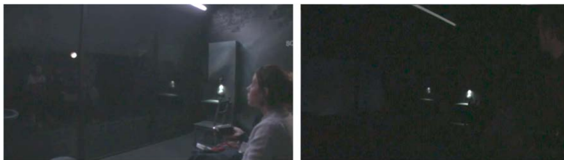
Fig. 7 – Exposition Prison , Théâtre immersif, Musée des Confluences de Lyon le 07.11.19.

Entre la salle orange et ce théâtre qui explore les frontières entre la puissance figurative de la mise en scène et la profondeur imaginative des visiteurs se manifeste une atténuation des frontières entre l'interprétation d'un discours sur les prisons au musée et l'expérience imaginaire d'une incarcération 9 . Cette dynamique de production muséale, entre expérimentation artistique et discours scientifique problématise alors le statut de la dimension partageable et traductible de l'expérience carcérale au musée. Que l'on soit dans le dispositif immersif ou dans le discours figuratif, une ligne de cohérence semble tout de même se dessiner, traversant et structurant l'itinéraire, du début à la fin: l'exposition Prison assume une position qui vise toujours à poser aux visiteurs les limites de leurs connaissances, qu'elles soient le fruit d'une recherche encyclopédique ou d'une expérience personnelle, et par là-même, les limites de ce que veut dire "faire société". Comment continuer à participer d'un système punitif qui tourne à vide? Quelles solutions alternatives mettre en œuvre collectivement de manière à réduire les violences et à rétablir des conditions de vie décentes?