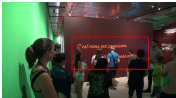
Fig. 1 – Exposition Prison , atelier webradio «Reporter au musée» au MICR de Genève, le 02.07.19.

Cette phrase catalyse une réflexion sur les rôles et les responsabilités de chaque acteur social dans les pratiques d'emprisonnement et d'enfermement, dans l'attribution des peines. Par ce “nous” inclusif et collectivisant, s'opère une première problématisation du positionnement des publics-citoyens aux côtés d'autres acteurs de la chaîne pénitentiaire. Cette énonciation, linguistiquement, pose en effet le problème d'une appartenance à un collectif dont chaque personne impliquée dans la vie d'une société est partie prenante de l'acte de punir, de ses effets directs (l'incarcération et la privation de liberté) comme de ses effets indirects (entrave à la réinsertion, dommages sociaux, psychologiques et physiques sur la vie des détenus comme sur celle de leur entourage). Une actorialisation se met en place où les publics ne sont plus seulement engagés dans une expérience esthétique ou dans une exploration encyclopédique du musée. Et les prisonniers ne sont plus des personnes que l'on peut continuer de garder à “l'ombre du monde” (Fassin 2015), en marge de la ville ou en dehors de son propre quotidien. Dirigeons-vous vers une autre médiation, plus complexe encore, juste à côté de cette phrase, dans la même séquence (“Punir”).