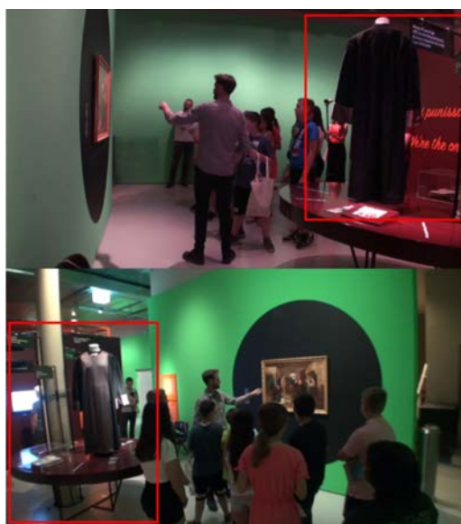
Fig. 2 – Exposition Prison , atelier webradio «Reporter au musée» au MICR de Genève, le 02.07.19.

À Genève, on trouve une robe de juge du canton de Vaud, en Suisse, qui trône sur cette table, en tant qu'emblème de la justice et de la décision pénale (encadrée en rouge dans la figure 2 ci-dessous).