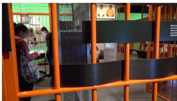
Fig. 5 – Exposition Prison , séquence «Détenu», Musée des Confluences de Lyon, le 07.11.19

Mais, en avançant dans la découverte et l'exploration de l'exposition, on se figure qu'il vise surtout à restituer les rapports de forces imposés et subis en prison, en jouant sur la circulation asymétrique des corps et des regards des visiteurs.