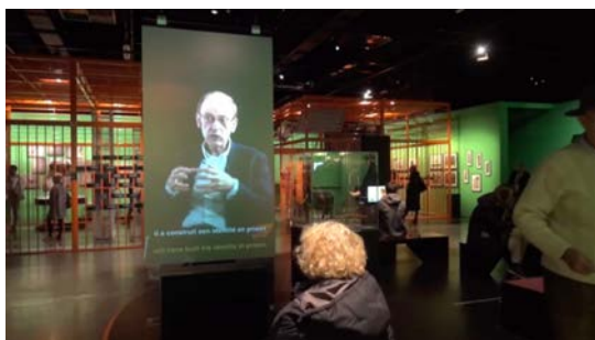
Fig. 4 – Exposition Prison , séquence «Alternatives», Musée des Confluences de Lyon, le 07.11.19.

En passant d'un discours scientifique sur les modèles architecturaux hérités du 19 ème siècle à des récits de témoignages se produit une effraction de frontières entre le dedans et le dehors des prisons, géographiquement et socialement policées, entre la texture des lieux qui émerge de vécus personnels et l'image médiatique qui en est construite depuis une perspective externe. En première approche, le parcours qui articule cellules à barreaux et espaces ouverts semble seulement mettre en scène l'environnement carcéral dans une dichotomie franche.