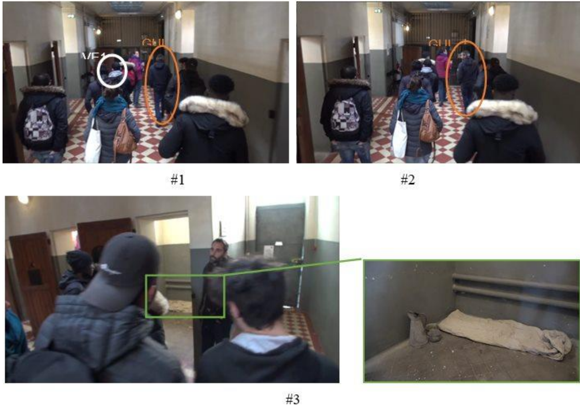
Figure 3. Images 1, 2 et 3 de l'extrait « Reconstitution un peu toc ». MNPM, le 07.01.20

Elliptique à propos des personnes désignées par « on » (dans « on est en train d'essayer de se mobiliser », qui est ce « on » ?), le discours du médiateur (GUI) nous fait néanmoins observer que cette mobilisation collective pour remplacer la paille relève d'une préoccupation éthique de montrer les différentes évolutions de la vie de ce bâtiment, à la fois sur le plan socio-politique (enjeux de pouvoir entre personnels et détenus ; évolution des traitements réservés selon les lois en vigueur) et sur le plan technologique (la présence d'une paille à la place d'un lit en métal rend compte d'un savoir-faire et d'une innovation matérielle).