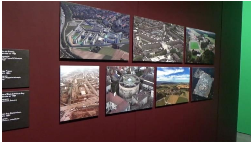
Figure 1. Gravures et photographies de prisons (en haut) ; Zoom sur les photographies (en bas). MDC, le 07.11.19