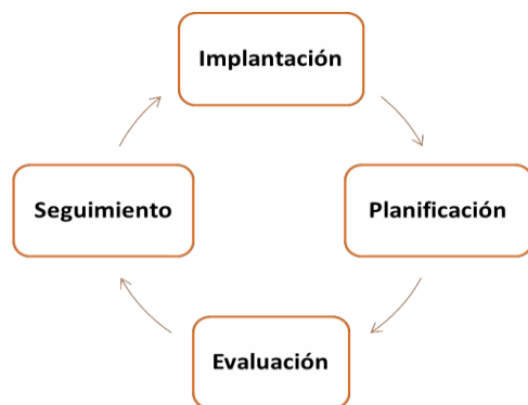
Figura 15. Esquema de fases a seguir guía de buenas prácticas.

La guía se encuentra estructurada de tal forma que se pueda realizar el proceso de mejoramiento y control a través de las 4 fases, presentadas en la Figura 15.