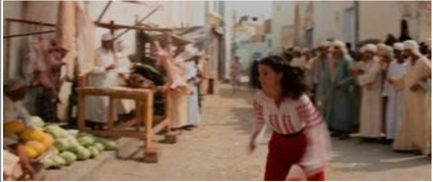
Ill.2. Indiana Jones et le temple maudit , 11'24 © Steven Spielberg / Lucasfilm Paramount

Les passages d'un continent à l'autre sont parfois évoqués au moyen des mêmes procédés, juxtaposant ou superposant la représentation du moyen de locomotion et celle d'un planisphère sur lequel le déplacement est symbolisé par une flèche 6 . Les véhicules qui permettent l'exploration de ce monde partagé sont étrangement similaires : avions, hydravions de toutes tailles, voitures, motos, side-cars, bateaux de tout tonnage, sous-marins... Plus significative, la rencontre de plusieurs de ces véhicules dans les différentes œuvres. Ainsi l'interception du bateau cargo par un sous-marin militaire est-elle présentée sur deux vignettes juxtaposées dans Coke en stock (p. 54), et dans la profondeur de champ d'un même plan dans Les Aventuriers de l'arche perdue (1'35'06).