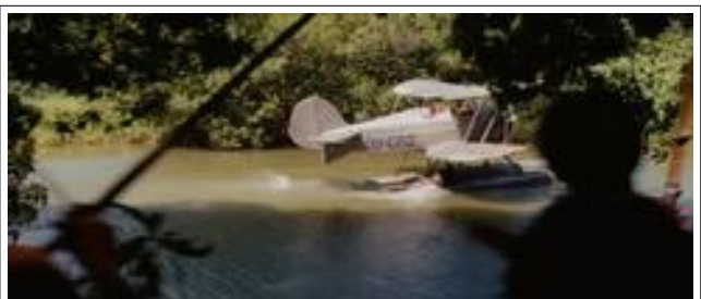
Ill.4 : Les Chevaliers de l'arche perdue , 0'12'10