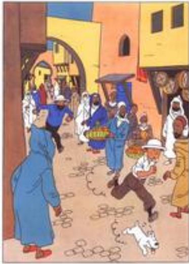
Ill.1. Le Crabe aux pinces d'or , p. 40 © Hergé / Moulinsart