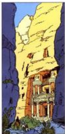
Ill.8 Coke en stock , p. 28 3-a © Hergé / Moulinsart

Mais c'est peut-être La dernière croisade qui reprend le plus précisément un certain nombre de lieux, de moyens de locomotion, et de situations, des aventures de Tintin : la poursuite en bateau à moteur à Venise évoque, jusque dans le détail des modèles de Hacker-Craft, Tintin au Pays des soviets ou Le Crabe aux pinces d'or . Indiana Jones, en voiture, est ensuite poursuivi par des avions, qui, comme dans Tintin au pays des soviets larguent une bombe pour l'intercepter. La grande poursuite finale cite celle de Coke en stock : le couple adapté / inadapté Tintin / Haddock est repris par le duo des professeurs Jones : l'un est à l'aise à cheval, l'autre monte à l'envers ; dans les deux cas, la poursuite, de façon dissymétrique, met aux prises des cavaliers avec des blindés ; interviennent alors des Arabes alliés, et dans les deux fictions, les personnages aboutissent au temple (bien réel dans La Dernière croisade ; inspiré dans Coke en Stock ) de Pétra (ill.8 et ill.9).