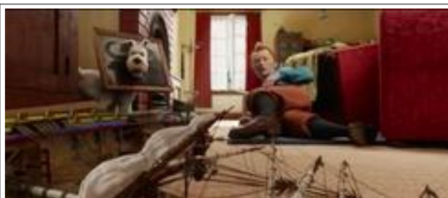
Ill.11. Les Aventures de Tintin, Le Secret de la Licorne , 9'42' © Steven Spielberg / Amblin entertainment, The Kennedy/Marshall Company, WingNut films

Chez Spielberg, le récit du combat joue sur d'autres procédés : Haddock, halluciné, s'est emparé non du sabre de son ancêtre mais d'un sabre de légionnaire. Il visualise d'abord Rackham le Rouge qui apparaît en contre-champ. Un nouveau contre-champ met en place le face à face avec le Chevalier de Haddock. Ensuite, pour une fraction de seconde, le Chevalier est masqué par deux marins ; lorsqu'ils s'écartent, le personnage qui apparaît est à nouveau le Capitaine : on voit en arrière-plan l'étagère du poste de Bagghar : pour un instant, les deux temporalités, celle du capitaine et celle du chevalier, cohabitent. La continuité du cinéma permet de ne pas scinder les chronologies : les fondus enchaînés et le morphing font coïncider, dans un même plan, le Grand Siècle et le petit vingtième.