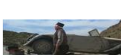
Ill.7. Indiana Jones et la dernière croisade , 1'15'39 © Steven Spielberg / Lucasfilm Paramount

La récurrence de ces citations montre qu'Hergé a inspiré de Broca qui a influencé Spielberg. La confrontation du premier épisode des aventures d'Indiana Jones à un public et à une critique européenne plus familiers de l'œuvre d'Hergé a amené Spielberg à conscientiser cet hypotexte, puis à se l'approprier. Il faut donc distinguer, dans sa filmographie, Les Aventuriers de l'arche perdue , (antérieur à la découverte de l'univers de Tintin), du reste de la saga Indiana Jones (qui lui est postérieure) : par bien des côtés, Le Temple Maudit , La Dernière croisade et Le Royaume du crâne de cristal peuvent se lire comme des réécritures des aventures de Tintin.