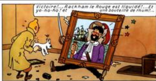
Ill.10. Le Secret de la Licorne, p.25.

Michel Serres ne dit pas autre chose, lorsqu'il évoque sa lecture de L'Oreille cassée : « À la fin de la page 55, Tintin, frappé d'un coup de pagaie, tombe dans le fleuve parmi les piranhas, et on ne voit plus qu'un grand rond dans l'eau rappelant la forme de son visage. » Et d'évoquer ensuite le tableau de Haddock : « Ces scènes rappellent ces attractions de foire où l'on passe la tête dans un trou au-dessus d'un costume factice. C'est le même principe avec la tête de Tintin : un trou par lequel chacun peut passer sa tête. Tintin, c'est le lecteur, c'est vous, c'est moi. » 18