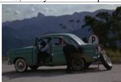
Ill.6. L'Homme de Rio , 55'46 © Philippe de Broca / Les Artistes Associés, Les Films Ariane, Vides Cinematografica, Dear Film Produzione