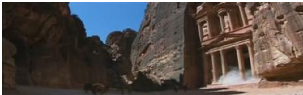
Ill.9. Indiana Jones et la dernière croisade , 1'53'48 © Steven Spielberg / Lucasfilm Paramount

Le Royaume du crâne de cristal semble s'inspirer de Tintin et les Picaros – les personnages qui fuient la pyramide sud-américaine (1'35'08) constituent une citation de la couverture de la bande dessinée – et Vol 714 pour Sidney . Dans ce dernier album, Hergé fait intervenir des extraterrestres, élément sans doute plus inattendu dans son univers que dans celui de Spielberg. À la fin du film, Indiana Jones contemple le départ d'une soucoupe volante, qui provoque un effondrement circulaire du sol, et sa submersion par les eaux de l'océan. Dans Vol 714 pour Sidney , le départ de la soucoupe est associé au mouvement giratoire de l'eau du lac qui « se vide comme vulgairre [ sic ] lavabo 16 ! »