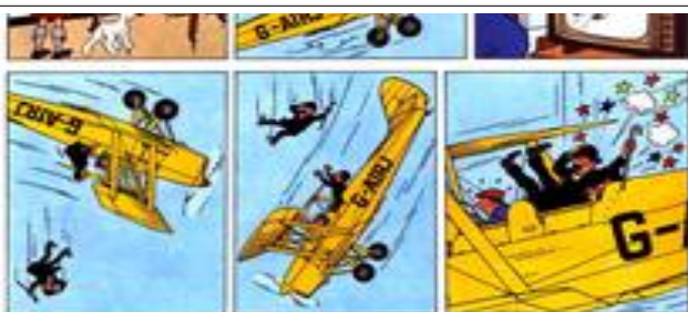
Ill.3 : L'Île noire , p. 55

Plus troublant encore, Hergé et Spielberg signent de la même façon, dans un clin d'œil métaleptique, les biplans de L'Île noire et de Les Aventuriers de l'arche perdue (ill.3 et ill.4) : le premier est immatriculé G-AIRJ (Hergé), et le second OB-CPO (Obi-Wan Kenobi, et C-3PO, deux personnages de la saga Star Wars , réalisée par Georges Lucas, le compère de Spielberg).