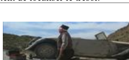
Ill.7. Indiana Jones et la dernière croisade , 1'15'39 © Steven Spielberg / Lucasfilm Paramount

La récurrence de ces citations montre qu'Hergé a inspiré de Broca qui a influencé Spielberg. La confrontation du premier épisode des aventures d'Indiana Jones à un public et à une critique européenne plus familiers de l'œuvre d'Hergé a amené Spielberg à conscientiser cet hypotexte, puis à se l'approprier. Il faut donc distinguer, dans sa filmographie, Les Aventuriers de l'arche perdue , (antérieur à la découverte de l'univers de Tintin), du reste de la saga Indiana Jones (qui lui est postérieure) : par bien des côtés, Le Temple Maudit , La Dernière croisade et Le Royaume du crâne de cristal peuvent se lire comme des réécritures des aventures de Tintin.