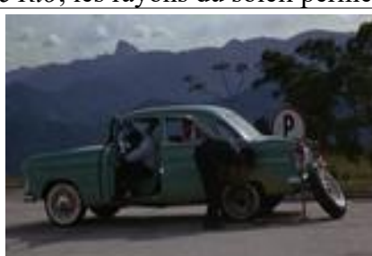
Ill.6. L'Homme de Rio , 55'46 © Philippe de Broca / Les Artistes Associés, Les Films Ariane, Vides Cinematografica, Dear Film Produzione