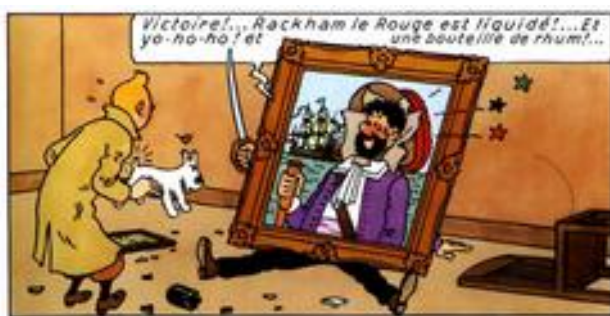
Ill.10. Le Secret de la Licorne, p.25.

Michel Serres ne dit pas autre chose, lorsqu'il évoque sa lecture de L'Oreille cassée : « À la fin de la page 55, Tintin, frappé d'un coup de pagaie, tombe dans le fleuve parmi les piranhas, et on ne voit plus qu'un grand rond dans l'eau rappelant la forme de son visage. » Et d'évoquer ensuite le tableau de Haddock : « Ces scènes rappellent ces attractions de foire où l'on passe la tête dans un trou au-dessus d'un costume factice. C'est le même principe avec la tête de Tintin : un trou par lequel chacun peut passer sa tête. Tintin, c'est le lecteur, c'est vous, c'est moi. » 18