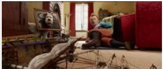
Ill.11. Les Aventures de Tintin, Le Secret de la Licorne , 9'42' © Steven Spielberg / Amblin entertainment, The Kennedy/ Marshall Company, WingNut films

Chez Spielberg, le récit du combat joue sur d'autres procédés : Haddock, halluciné, s'est emparé non du sabre de son ancêtre mais d'un sabre de légionnaire. Il visualise d'abord Rackham le Rouge qui apparaît en contre-champ. Un nouveau contre-champ met en place le face à face avec le Chevalier de Haddock. Ensuite, pour une fraction de seconde, le Chevalier est masqué par deux marins ; lorsqu'ils s'écartent, le personnage qui apparaît est à nouveau le Capitaine : on voit en arrière-plan l'étagère du poste de Bagghar : pour un instant, les deux temporalités, celle du capitaine et celle du chevalier, cohabitent. La continuité du cinéma permet de ne pas scinder les chronologies : les fondus enchaînés et le morphing font coïncider, dans un même plan, le Grand Siècle et le petit vingtième.