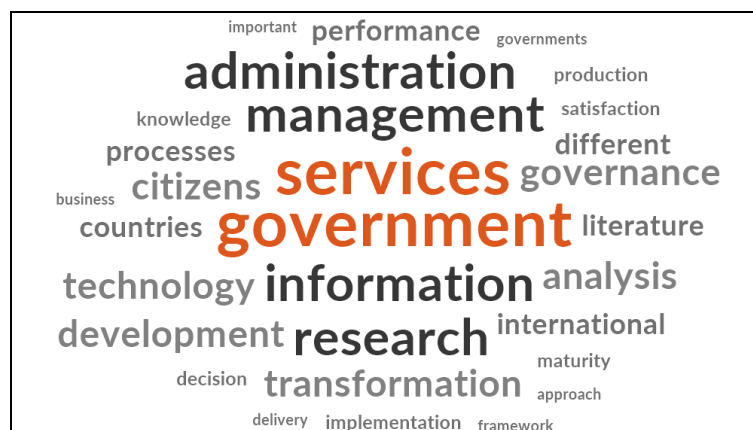
Figure 1 : Nuage de mots