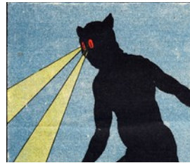
Fig. 4 Miramar Illustration d'E. Creté

Le dessinateur Raoul Serres montre le cambrioleur coiffé de la paire de lunettes opaques (fig. 2), mais aussi caché dans l'obscurité, avec pour seules trouées lumineuses ses pupilles blanches qui réfléchissent une source lumineuse voisine (fig. 3). Félix Jobbé-Duval pour Miramar de Guillaume Livet, montre les yeux écarquillés de l'homme-félin, pupilles rétrécies sur la couverture de 1913. E. Creté, quant à lui, réalise une curieuse illustration