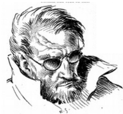
Fig. 2 L'Homme aux yeux de chat Illustration de Raoul Serres