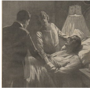
Fig. 6 et 7 L'Uomo truccato – Illustrations de R. Salvadori ?

Si les illustrations internes de l'édition de 1923 ont un intérêt moindre, puisqu'aucune d'entre elles ne se risquent à représenter la vision fabuleuse du héros, on ne peut pas en dire autant de sa parution en 1924 dans le journal italien Il Romanzo Mensile , qui représente à plusieurs reprises le regard de Jean. Il Romanzo Mensile (fig. 6 et 7), tout comme les illustrations de Rzewuski (fig. 8), parues en 1921 dans la première publication de L'homme truqué dans Je sais tout , se posent la question de la manière de figurer un aveugle voyant. Bien que les yeux du héros soient parfaitement vides d'expression, et que dans ses orbites se loge un appareil comparé une pelote capillaire recouverte d'émail, la profondeur de ses traits suggère qu'il voit aussi bien, sinon mieux, que son entourage. Les lunettes qu'il porte pour masquer son regard déroutant 1 , comparé à celui d'une statue, sont chaque