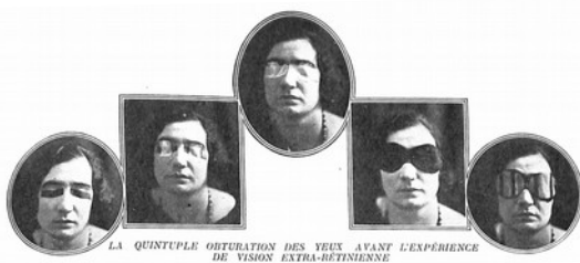
Fig. 12 E. Vuillermoz, « La vision sans yeux », Je sais tout , 15 avr. 1923, p. 227.

De nombreux cas, dans les études métapsychiques, traitent de patients capables de voir sans les yeux (fig. 12), perceptions sans objet réel : somnambulisme de Puységur par exemple, et hypnose de Braid. Dans les années 1923, un certain nombre d'articles sérieux paraissent au sujet de la vision dite « extrarétinienne », ou « vision paroptique », qui consiste à voir sans le secours des yeux, généralement par la peau (« vision cutanée »). Cette faculté est rapportée avec intérêt par les journaux, qui pensent voir là le témoignage d'un phénomène scientifique encore imparfaitement compris. L'intérêt montré pour cette faculté singulière provient de la préexistence de cette interrogation dans le cadre des études métapsychiques, sous le terme de « cryptesthésie ».