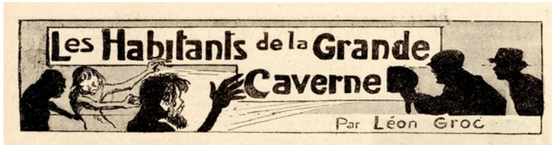
Fig. 13 Les Habitants de la grande caverne – Titre de Maurice Toussaint Le Petit inventeur , n° 143, 8 déc. 1925, p. 3.

cavernes, alors que les aventuriers sont chaque fois montrés de dos ou dans l'ombre.