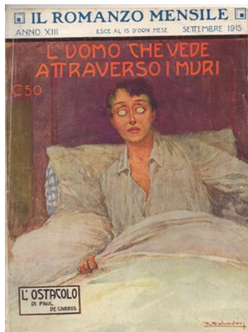
Fig. 11 L'Uomo che vede attraverso i muri Couverture de R. Salvadori