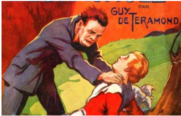
Fig. 1 Martha l'Espagnole Couverture d'Henry Armengol

Elle se transforme en greffe de cerveau complète dans un récit de 1928, Martha l'Espagnole 3 . Dans le récit de Téraumont, le héros porte des lunettes épaisses qui empêchent de deviner ses yeux jaunes carnassiers 4 , dessinés par Henry Armengol sur la couverture de la réédition titrée Martha l'Espagnole (Fig. 1). C'est le même accessoire de dissimulation, bleuté cette fois, qui est utilisé par Roger Francis Didelot, dans L'homme aux yeux de chat 5 (1934). Le récit, paru dans la revue Lectures pour tous , met en scène Maurice Langlade, un personnage nyctalope. Grâce aux yeux qu'un médecin lui a greffés, il commet tranquillement crimes et autres larcins.