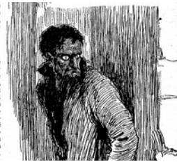
Fig. 3 L'Homme aux yeux de chat Illustration de Raoul Serres