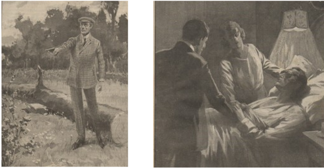
Fig. 6 et 7 L'Uomo truccato – Illustrations de R. Salvadori ?

Le soldat, tenant une canne d'aveugle et portant sa main ouverte comme pour se prémunir d'un choc, voit flotter tout autour de lui des orbes lumineux. Si ces cercles colorés rappellent les nombreuses photographies de Baraduc sur la prétendue force odique dégagée par les êtres vivants, elle est aussi étroitement liée aux recherches sur la vision subjective, puisqu'à la fin des années 1880 les physiologistes prennent en compte la possibilité de percevoir des phénomènes lumineux, qui n'existent pas autre part que dans l'œil de celui qui les perçoit. Sur la couverture de L'homme truqué , les bulles colorées peuvent alors s'apparenter aux frottements de paupière et autres phénomènes de sensations subjectives de lumière. En effet, la rétine, lorsqu'elle est stimulée, électrisée, malmenée, ne répond pas par de la douleur, mais par la production d'une image lumineuse.