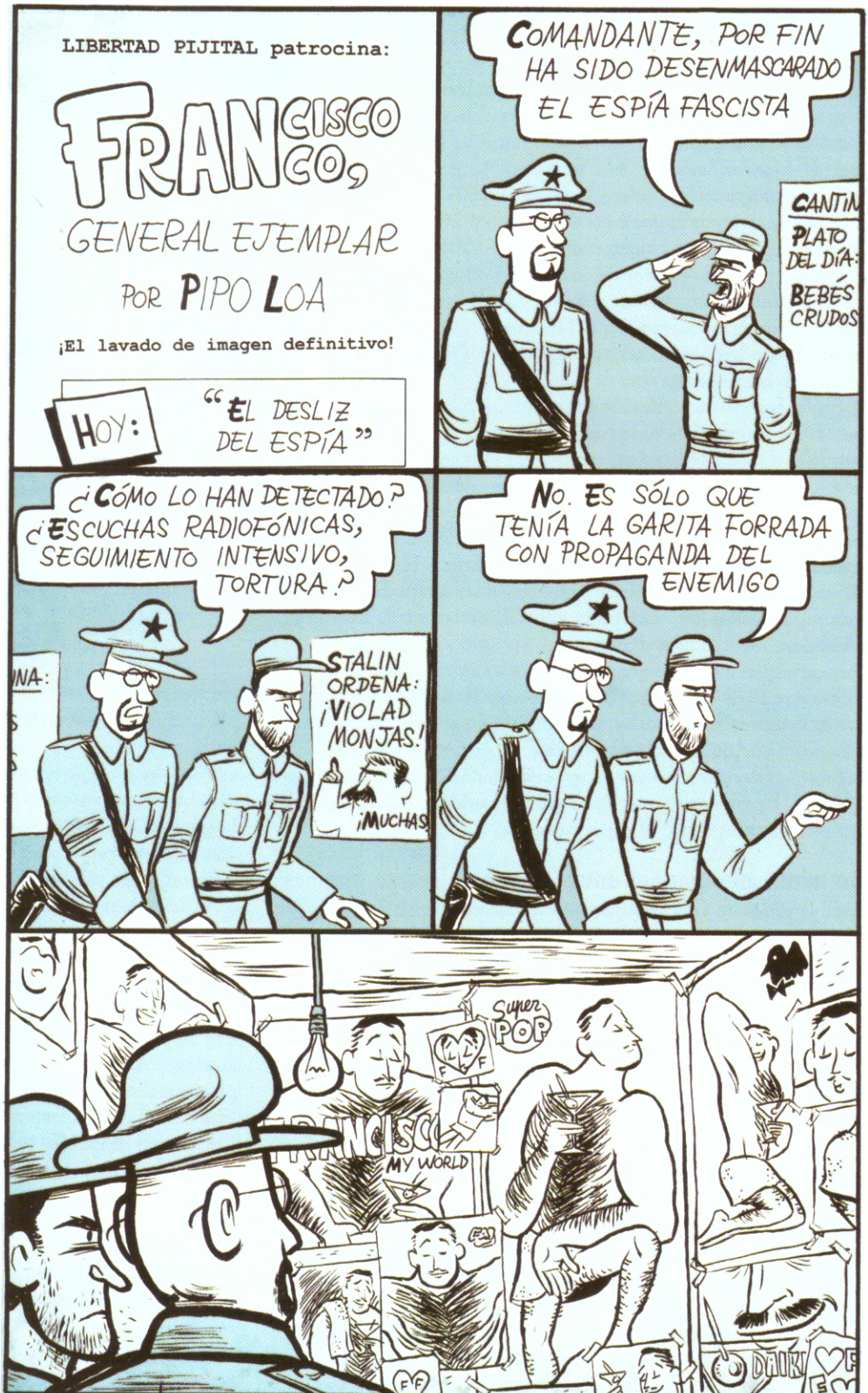
“L’erreur de l’espion”