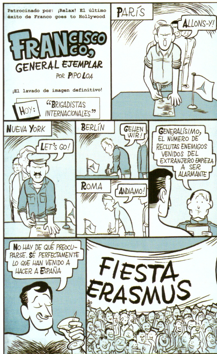
« Brigadistes internationaux »