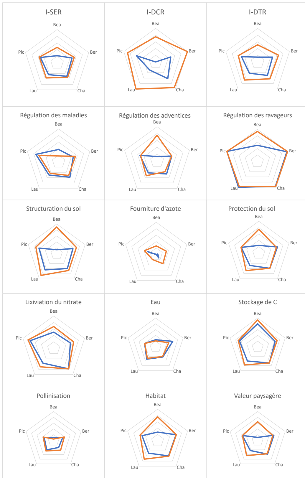
Figure 3 : Comparaison pour l'ensemble des indicateurs temporels de cinq rotations de cultures (Bea : Béarn ; Ber : Berry ; Cha : Champagne ; Lau : lauragais ; PIC : Picardie) entre système de culture de référence (en bleu) et systèmes de culture innovants diversifiés (en orange) proposés dans le cadre des plates-formes expérimentales du projet SYPPRE (Viguier et al. , 2021).